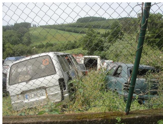
Figuras 7, 8 e 9: Sucata diversa, maioritariamente VFV, dentro do terreno vedado.