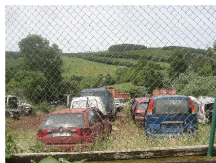
Figuras 4, 5 e 6: Sucata diversa, maioritariamente VFV, dentro do terreno vedado.