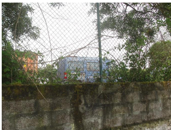
Figuras 2 e 3: Sucata diversa, maioritariamente VFV, dentro do terreno vedado.