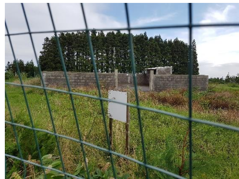
Figuras 2, 3 e 4: Ecocentro do Salão