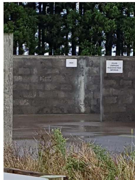
Figuras 5 e 6: Ecocentro do Salão