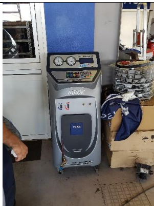
Figura 2: Máquina de intervenção em ar condicionado de veículos automóveis.