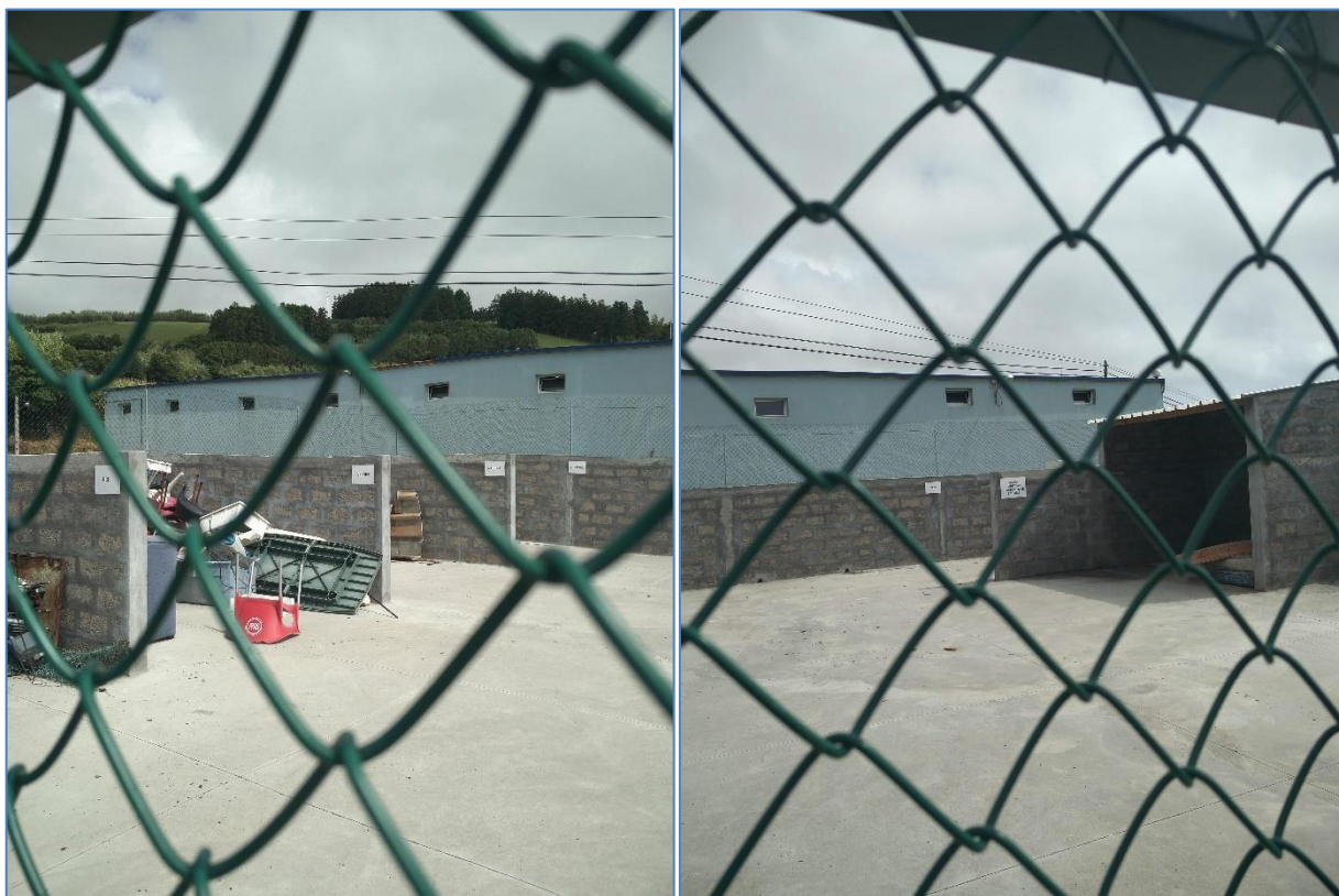
Figura 2.1: Alguns resíduos armazenados no estabelecimento.