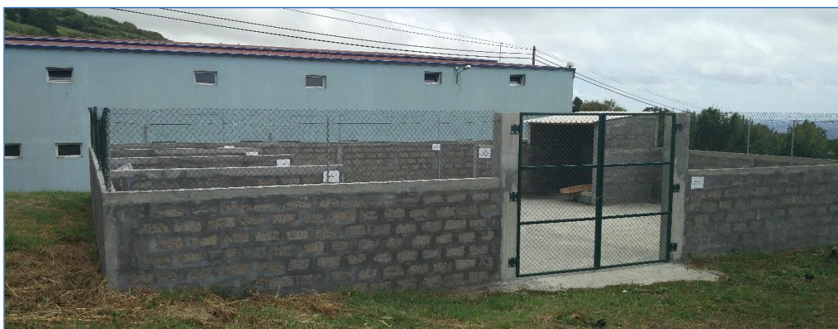
Figura 2.1: Aspeto geral do estabelecimento.

Na deslocação ao estabelecimento verificou-se que o mesmo se encontrava encerrado. No interior do mesmo encontravam-se armazenados alguns resíduos urbanos, designadamente mobiliário e colchões.