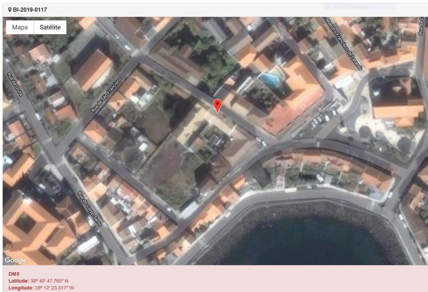
Figura 1.1: Localização do estabelecimento inspecionado.