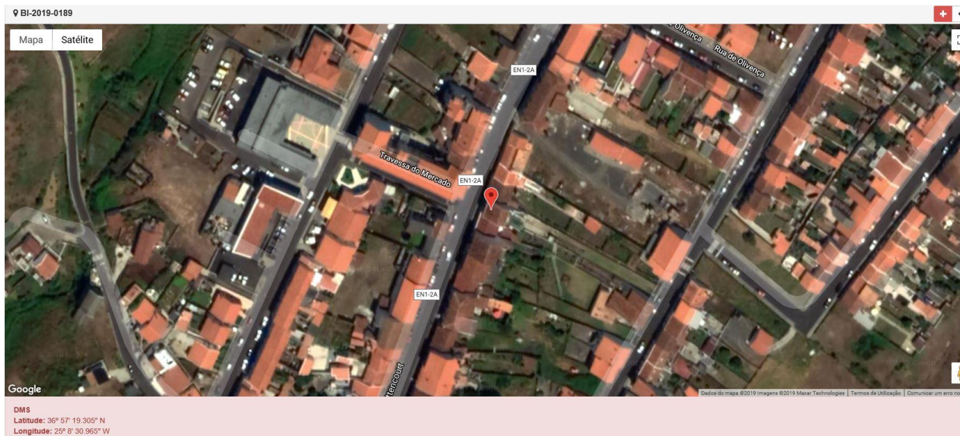
Figura 1.1: Localização do estabelecimento inspecionado.

Licenciamento da atividade: Alvará de Utilização nº 51/2010