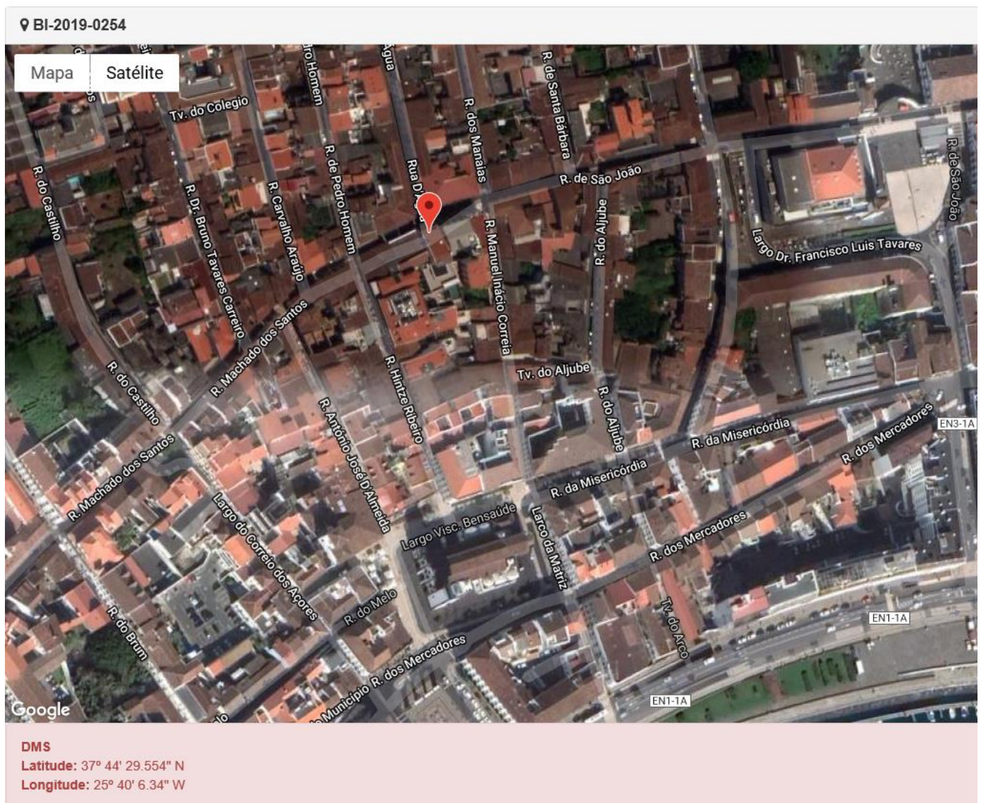
Figura 1.1: Localização do estabelecimento inspecionado.