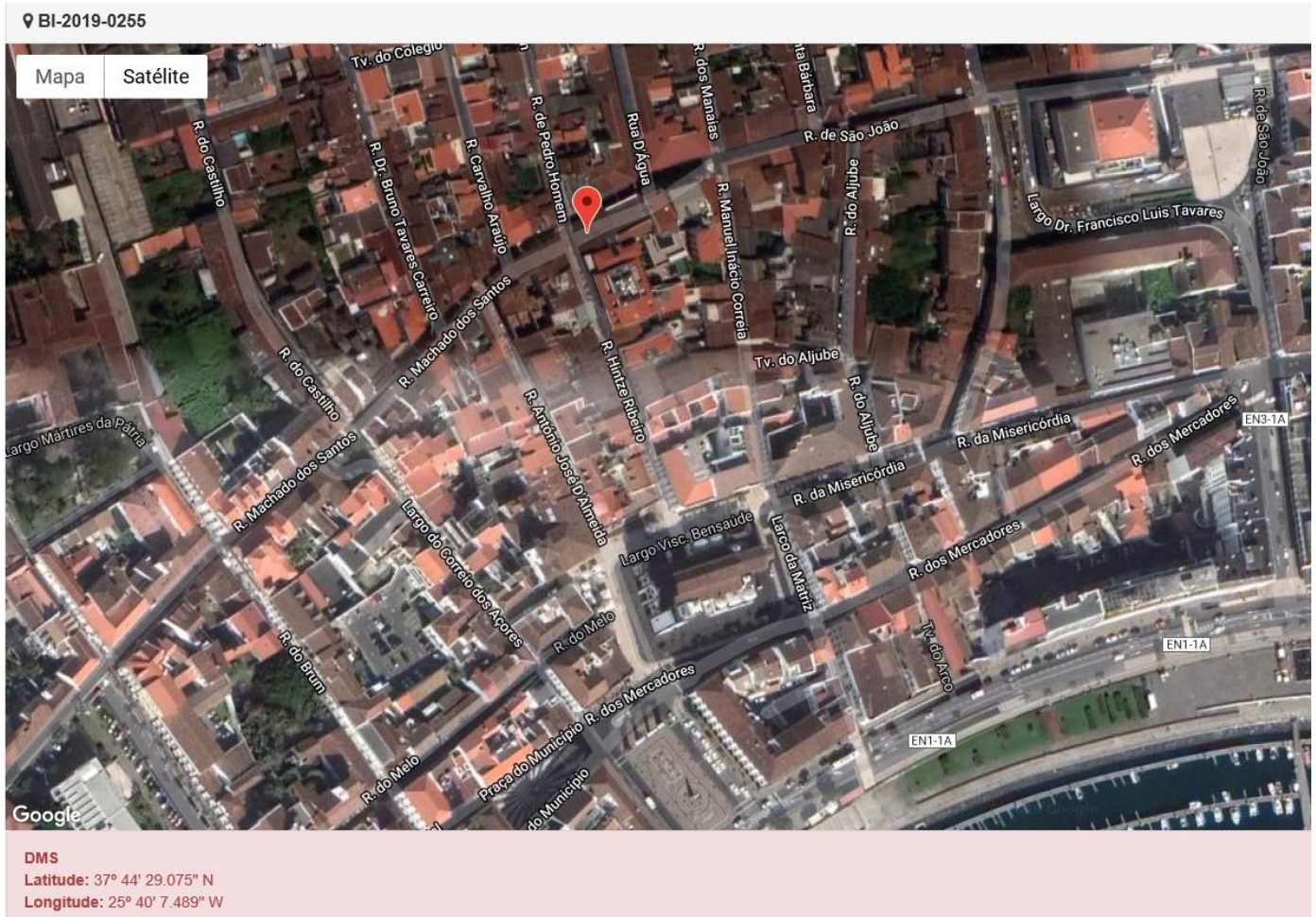
Figura 1.1: Localização do estabelecimento inspecionado.