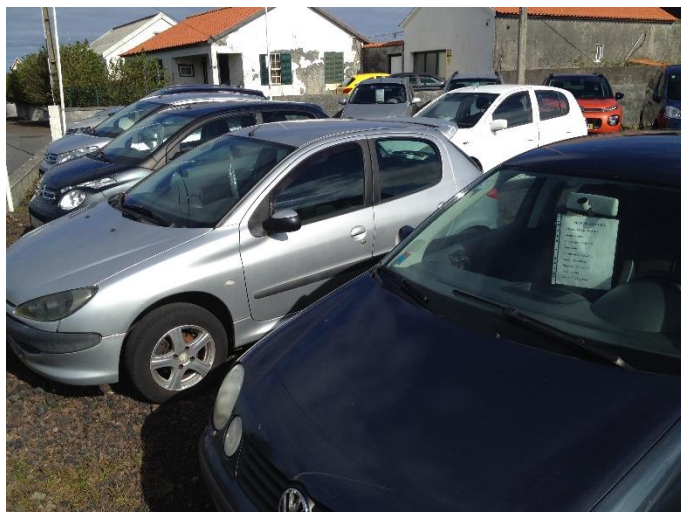
Foto 6 – Aspeto do estacionamento de viaturas para revenda no terreno.