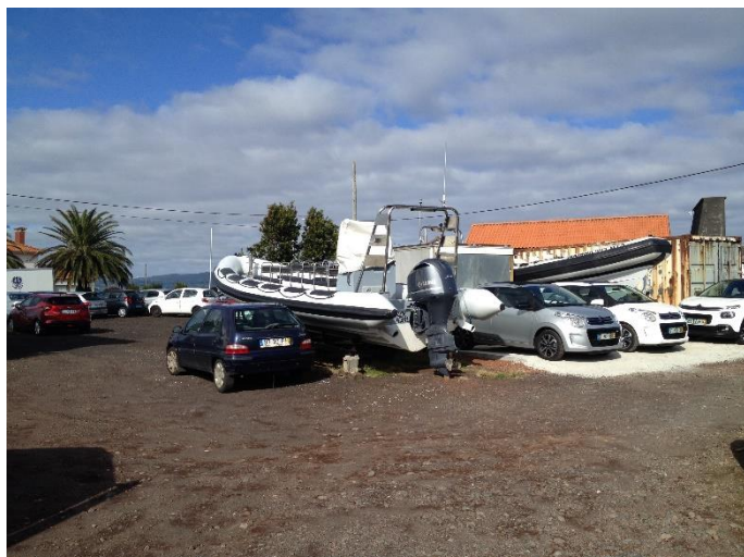
Foto 5 – Aspeto do estacionamento das viaturas e barcos no terreno.