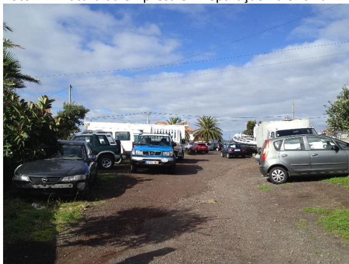
Foto 4 – Aspeto do estacionamento das viaturas à saída da oficina.