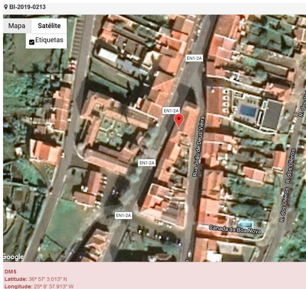
Figura 1.1: Localização do estabelecimento inspecionado.