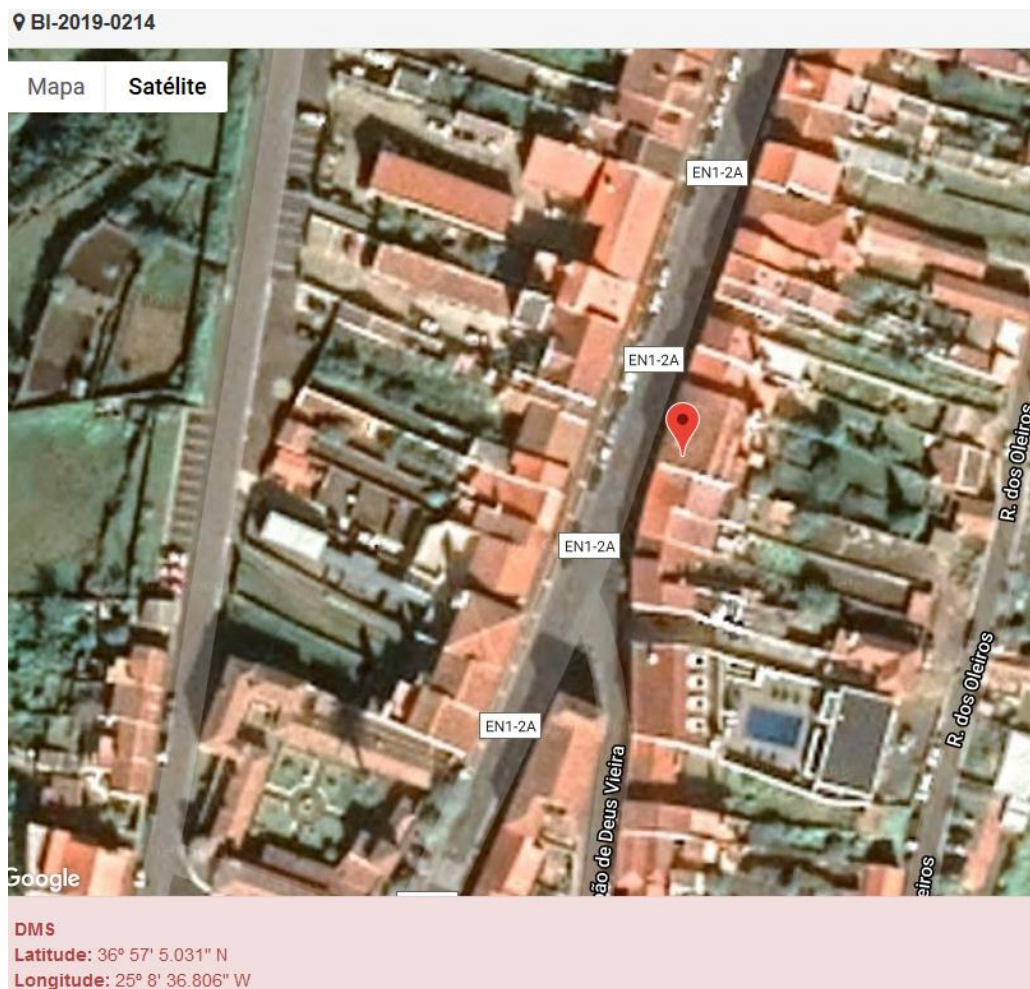
Figura 1.1: Localização do estabelecimento inspecionado.