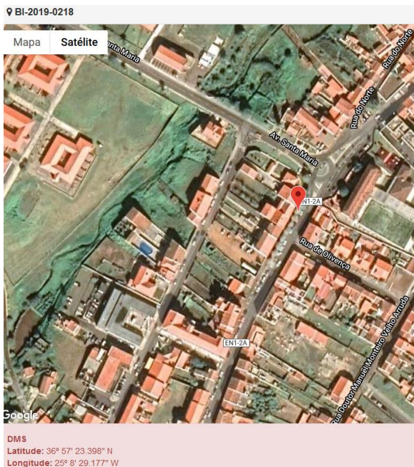
Figura 1.1: Localização do estabelecimento inspecionado.