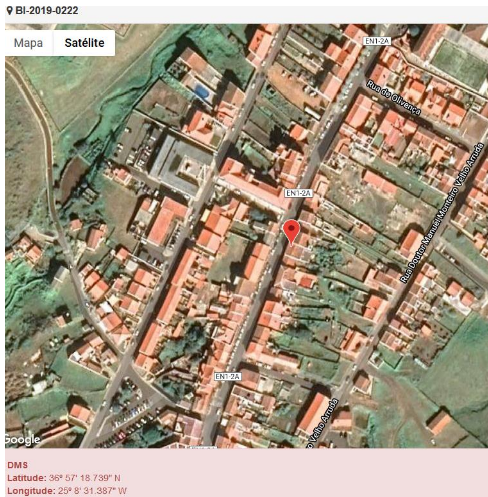
Figura 1.1: Localização do estabelecimento inspecionado.