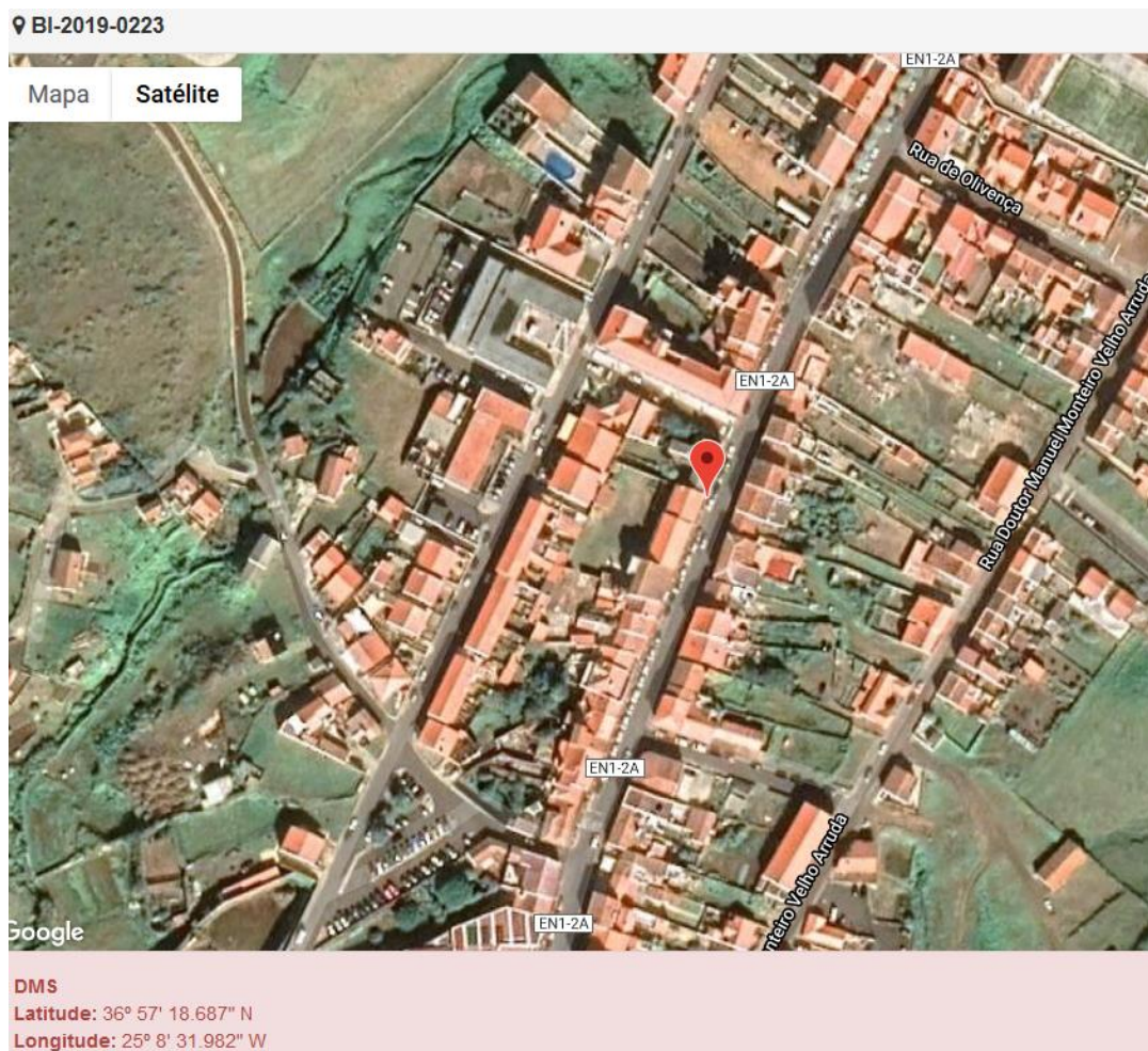
Figura 1.1: Localização do estabelecimento inspecionado.