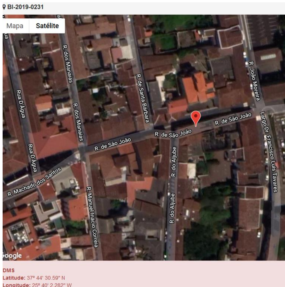
Figura 1.1: Localização do estabelecimento inspecionado.