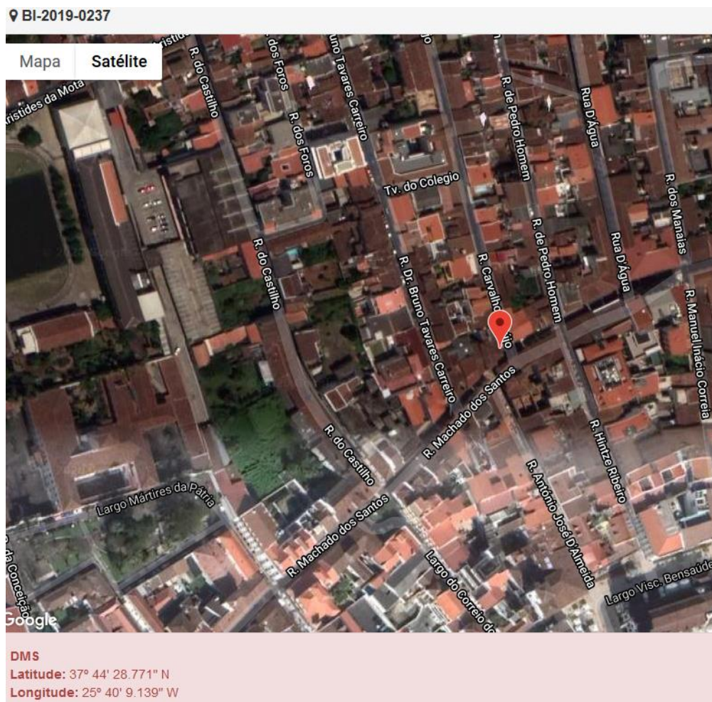
Figura 1.1: Localização do estabelecimento inspecionado.