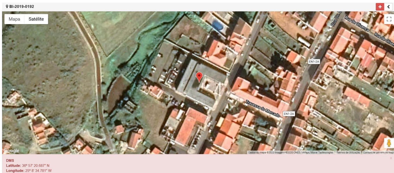
Figura 1.1: Localização do estabelecimento inspecionado.

Licenciamento da atividade: Isento - Propriedade da CMVP