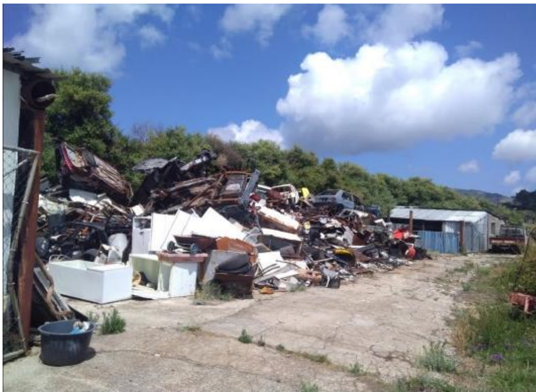
Figura 2.1: Resíduos depositados em 19/01/2018 e 16/07/2018