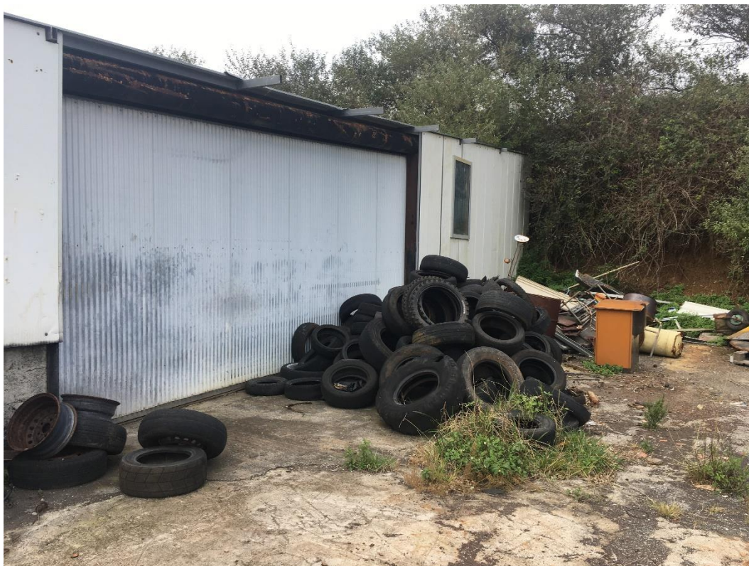
Figura 2.3: Resíduos depositados no local.

Encontravam-se depositados, numa parte das instalações, outros resíduos, maioritariamente pneus usados, resíduos esses que não se encontravam identificados anteriormente.