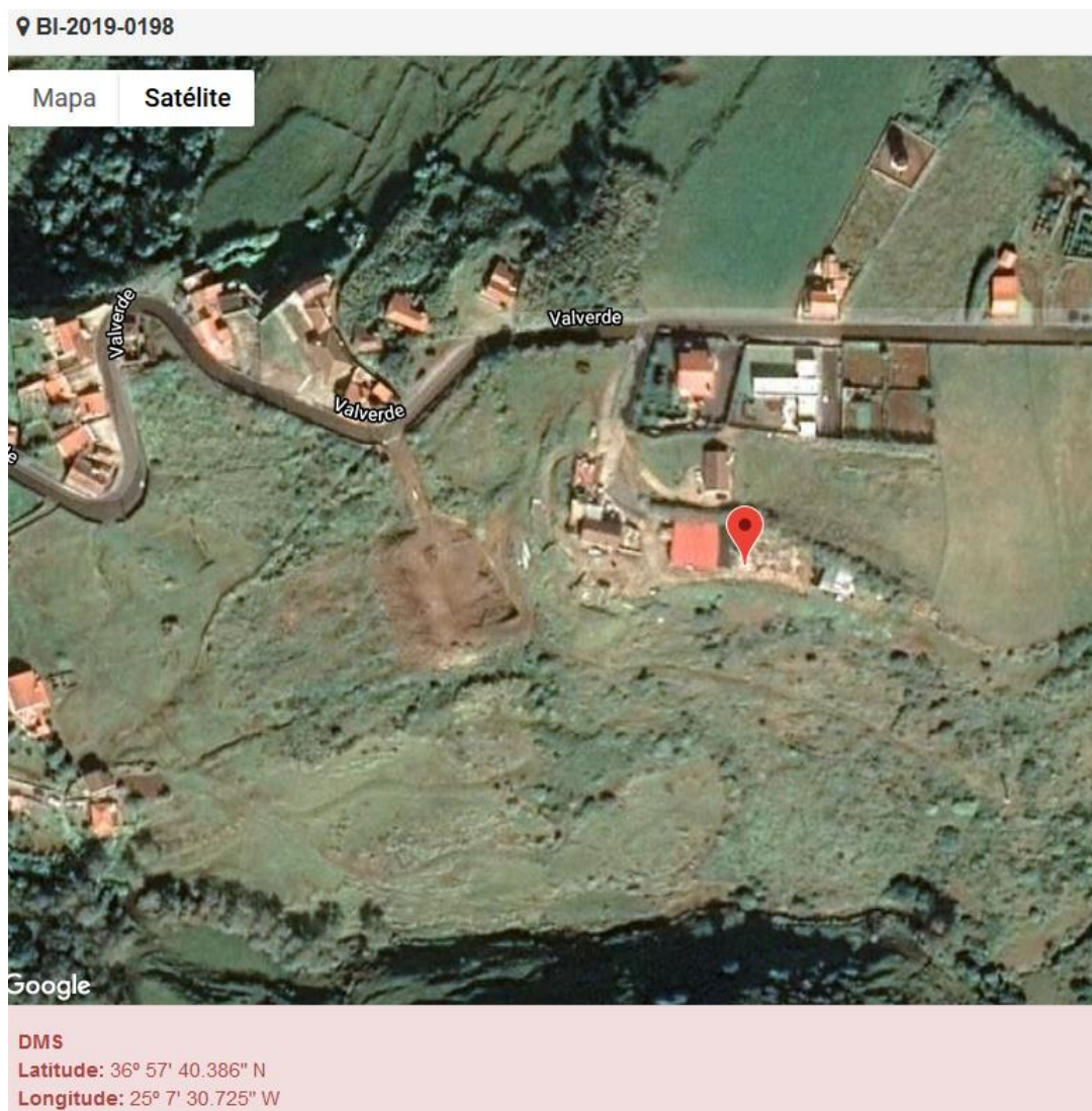
Figura 1.1: Localização do estabelecimento inspecionado.