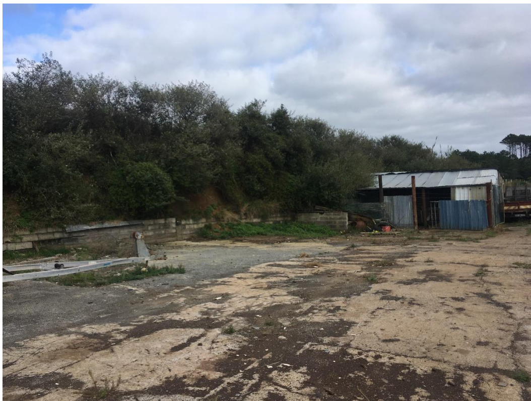
Figura 2.2: Aspeto do local em 06/11/2019