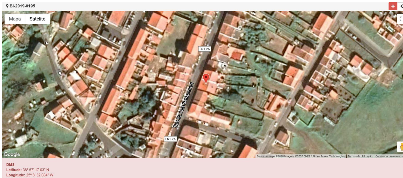
Figura 1.1: Localização do estabelecimento inspecionado.

Licenciamento da atividade: Alvará de Utilização nº 54/2005