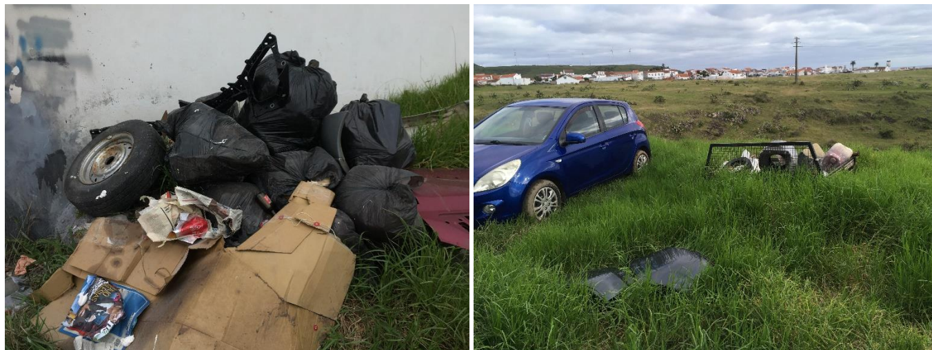
Figura 2.2: Resíduos depositados no exterior das instalações.