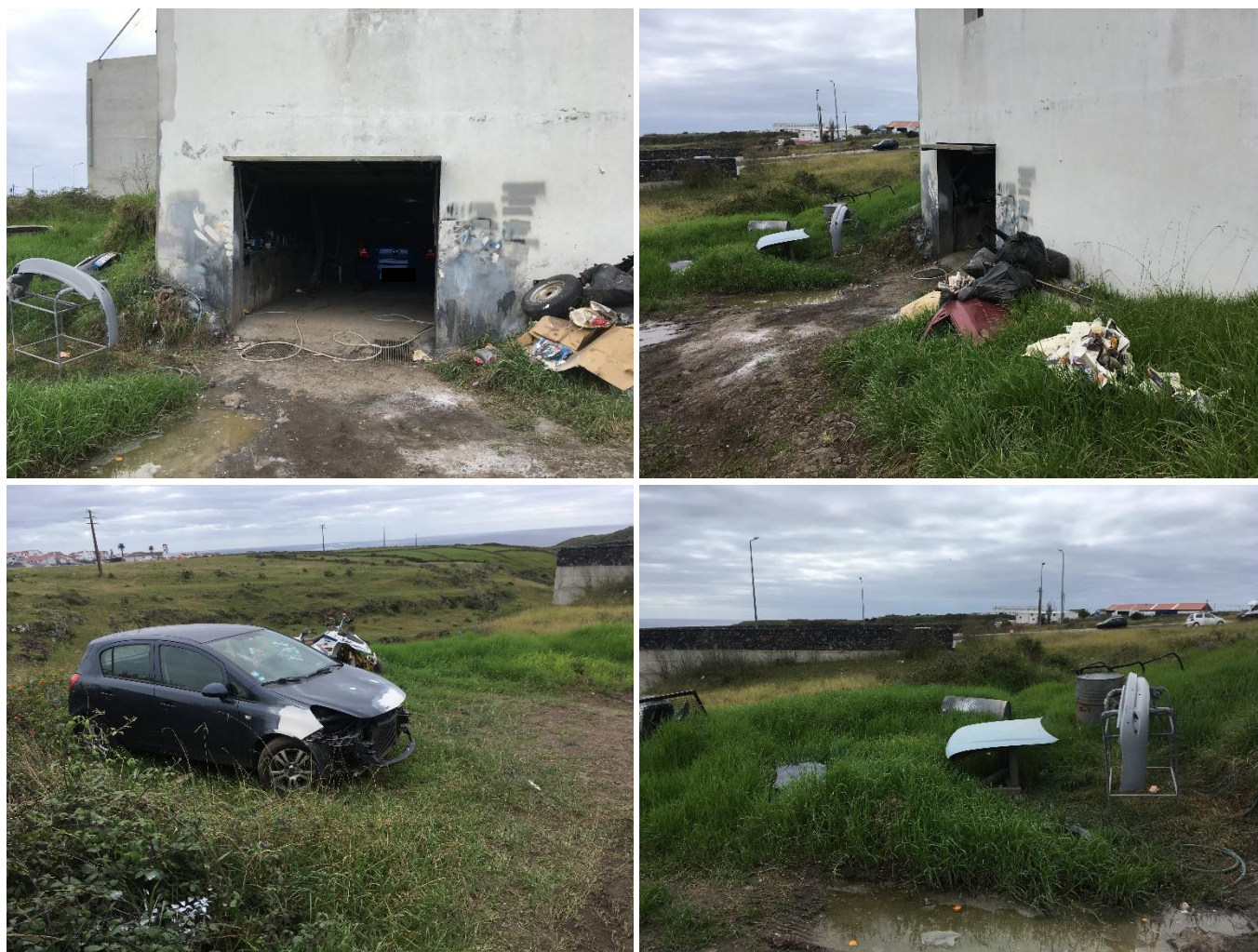
Figura 2.1: Garagem onde são efetuadas as pinturas auto e peças auto no exterior.

A pessoa contactada no local, identificou-se como funcionário da empresa Remaçor e referiu que o espaço era alugado por essa empresa para a execução de: polimentos, pintura de retoques, colagem de vidros e aplicação de preto fosco em viaturas, visto a empresa não dispor de espaço na sua oficina auto para a execução desses trabalhos.