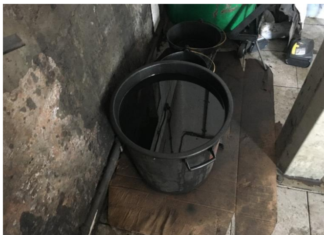
Foto 2 – armazenamento de óleo usado sem identificação, sem bacia de retenção.