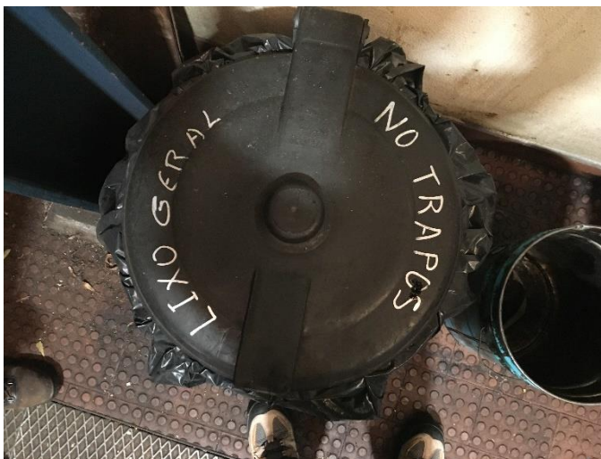
Foto 3 – Contentor Lixo Geral, onde colocam várias tipologias de resíduos.