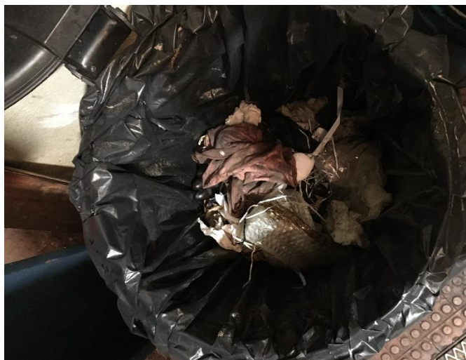
Foto 4 – Mistura de resíduos no contentor “Lixo Geral”, incluindo trapos contaminados.