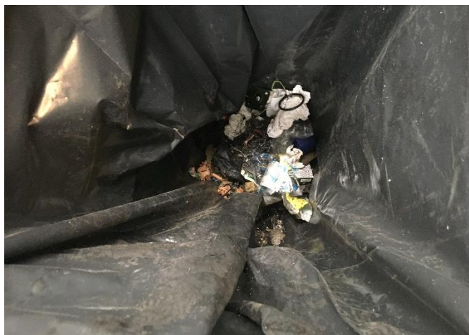
Foto 2 – Mistura de várias tipologias de resíduos no contentor “Resíduos Indiferenciados”.