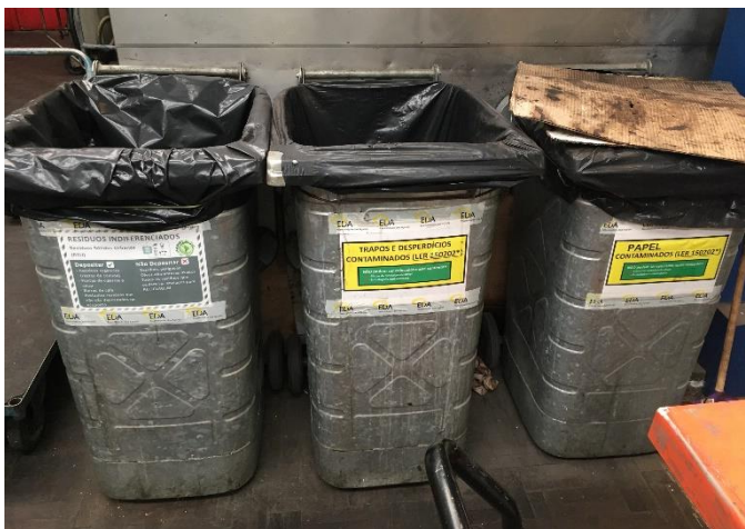
Foto 1 – Contentor Resíduos Indiferenciados na Oficina, onde colocam várias tipologias de resíduos.