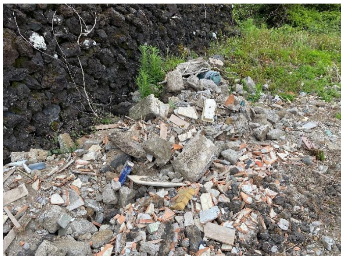
Foto 5 – Resíduos de demolição contendo embalagens, resíduos elétricos, plásticos, mosaicos, etc.