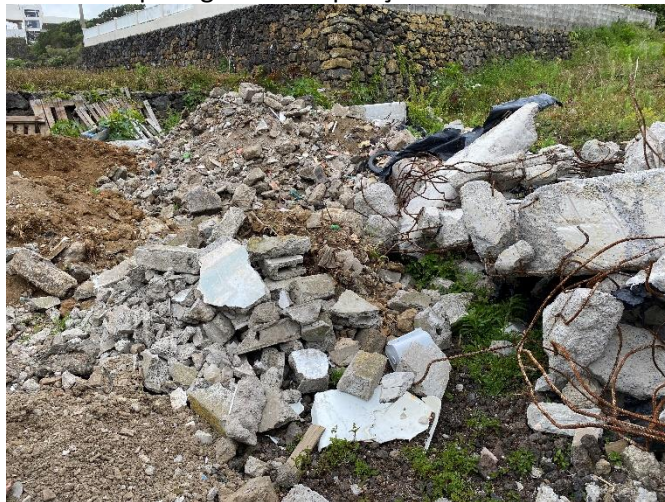
Foto 4 – Resíduos de betão contendo ferro de armaduras, outros resíduos de cimento (blocos), paletes de madeira, etc.