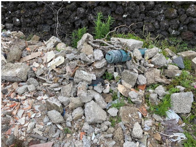
Foto 3 – Resíduos de betão (blocos de cimento) misturados com outros resíduos (plásticos, tubagens, caixas de eletricidade, etc.)