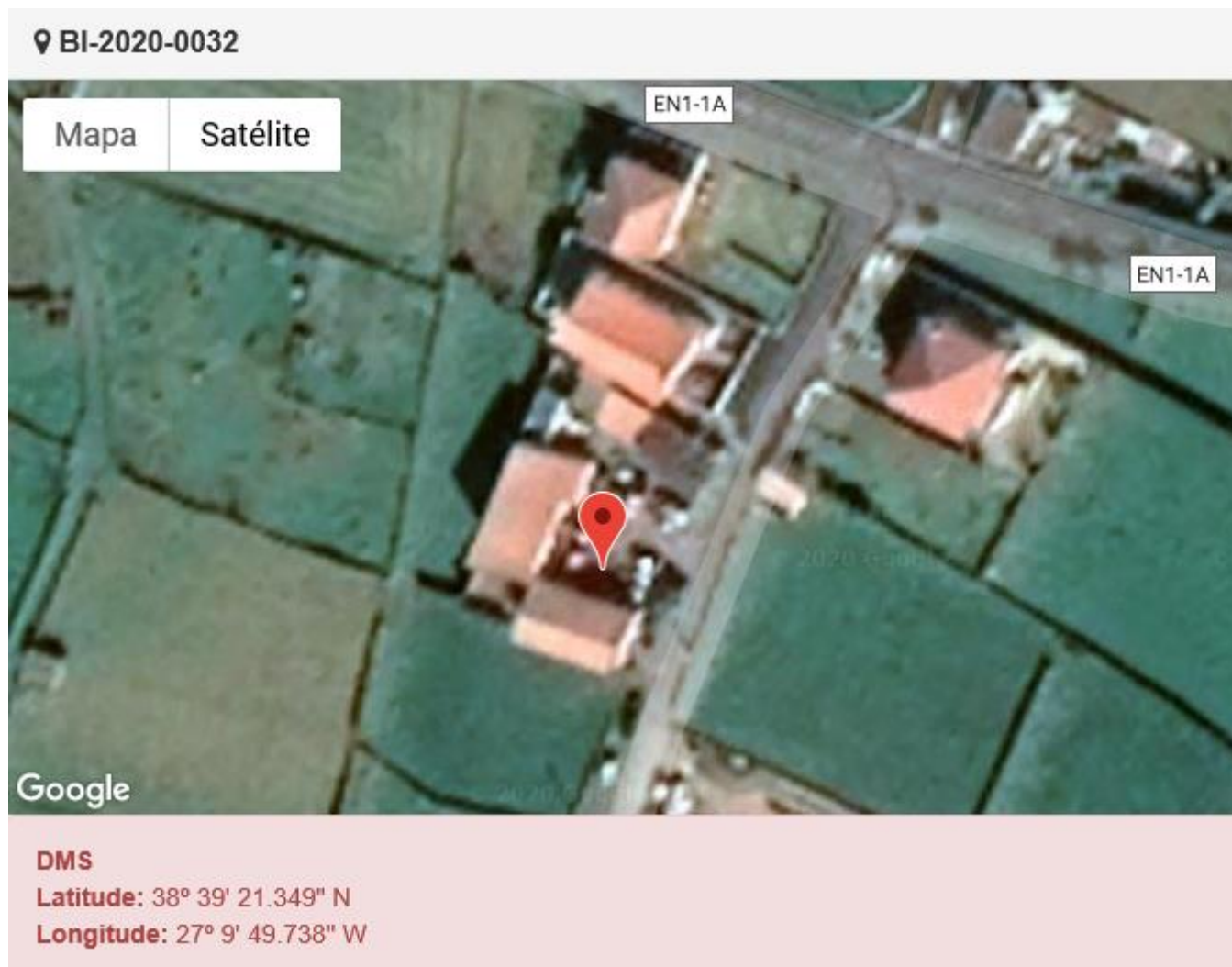
Figura 1.1: Localização do estabelecimento inspecionado.