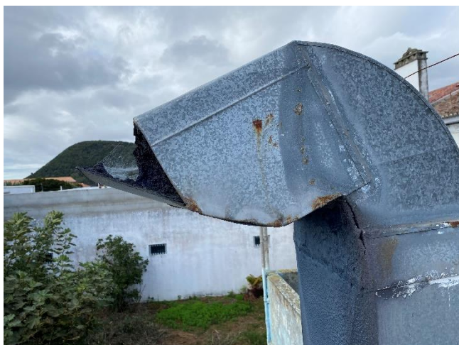
Foto 7 – Pormenor da saída da chaminé, com partículas de tinta acumuladas (a amontoar) na sua saída. Verifica-se também a corrosão da chaminé, que já apresenta fendas.