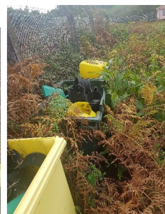
Figuras 9, 10 e 11: Resíduos depositados na zona de proteção imediata e envolvidos na vegetação (plásticos, partes de contentores plásticos e partes de tubagens de plástico)