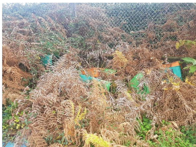
Figuras 7 e 8: Resíduos depositados na zona de proteção imediata e envolvidos na vegetação (essencialmente plásticos e partes de contentores plásticos)