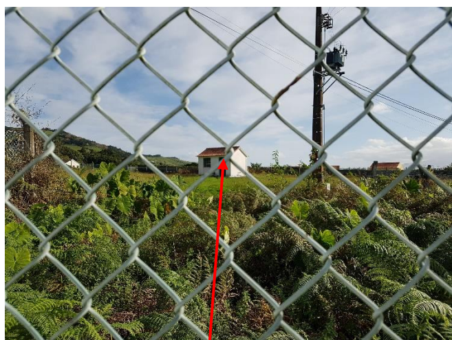
Figura 3: Casa com o quadro elétrico e comando da bomba do Furo do Capitão e respetiva vedação.