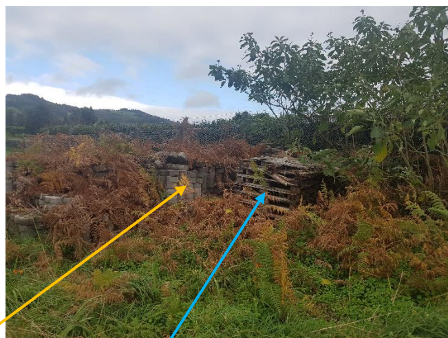
Figuras 5 e 6: Resíduos depositados na zona de proteção imediata e envolvidos na vegetação ( partes de tubagens , cabos , blocos de cimento , paletes de madeira partidas , entre outros)