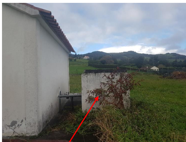
Figura 4: Estrutura que contém a captação de água.