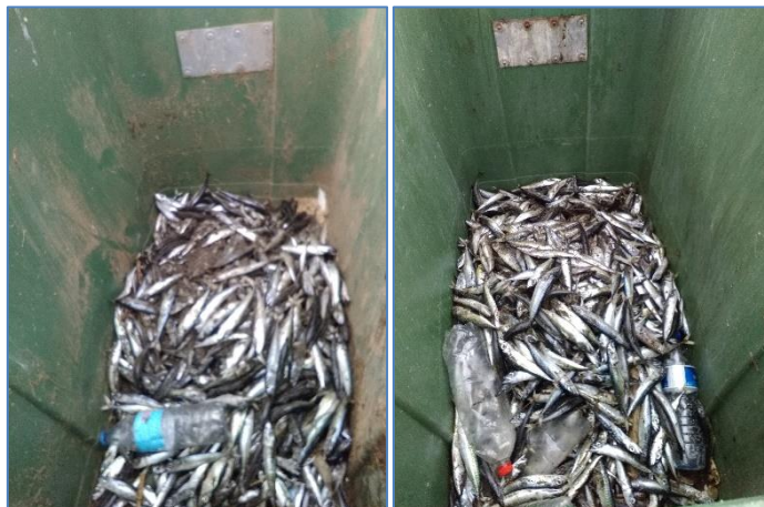
Figura 2.1: Pescado apanhado na praia.

Deslocámo-nos de seguida à lota do porto de pescas de Vila Franca do Campo onde fomos informados que o aparecimento daquele pescado na praia não tinha qualquer relação com a atividade da lota. Segundo o responsável, é habitual os barcos de pesca de chicharro apanharem também na rede cavala de pequena dimensão que não pode ser comercializada por não ter o tamanho mínimo. Alegadamente, os pescadores fazem a escolha no barco, e antes de chegar à lota deitam fora, no mar, o pescado que não reúne as condições para comercialização. O facto de ter aparecido na praia da Vinha da Areia estará relacionado com as condições da maré e com o local onde terá sido despejado. Informou ainda que operam habitualmente naquele porto 13 ou 14 embarcações dedicadas à pesca de chicharro.