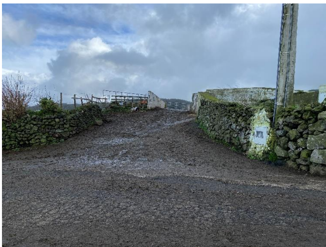
Foto 5 – Entrada da exploração pecuária referida pelo reclamante (ponto 2 na planta).