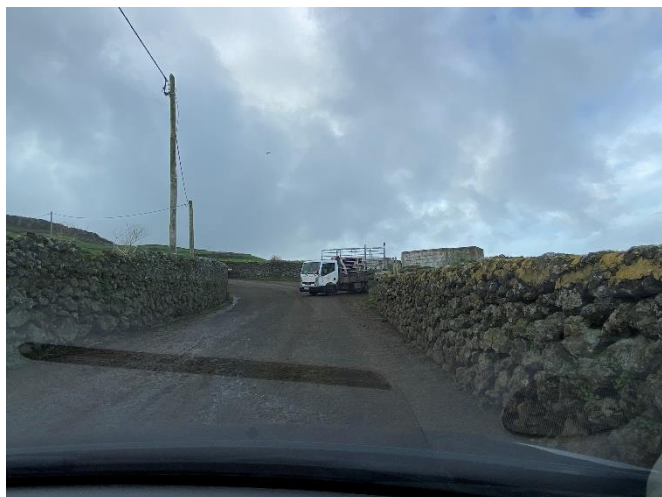
Foto 1 – Carregador de gado na Canada do Esteves (ponto 3 na planta de localização)

Este caminho (Canada do Esteves) encontra-se ladeado de dois talvegues com pastos, funcionando como linha de drenagem de uma pequena bacia hidrográfica entre os mesmos. Verifica-se que todas as entradas de pastos ou ligações de outros caminhos com pendente para este apresentam potencial para contribuir para os escoamentos da Canada do Esteves, pelo que se tratará de uma situação a ser resolvida pela entidade gestora da via em questão, classificada como caminho municipal (caminhos municipais n.º 1043 e n.º 1044) , no âmbito do enquadramento legal descrito no ponto 2.4.