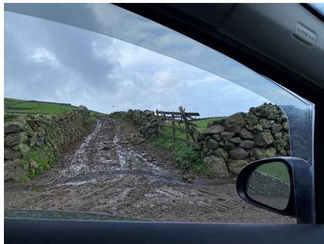
Foto 4 – Caminho agrícola com ligação à Canada do Esteves (ponto 1 na planta).