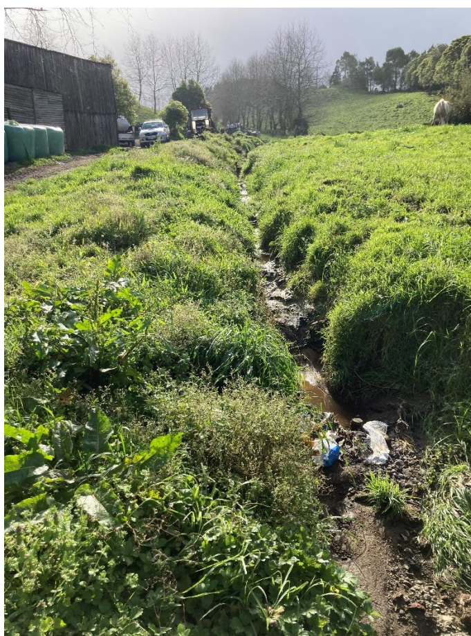
Figura 6: Afluente da Ribeira da Tranca que atravessa a exploração pecuária. Identificada na Figura 7.

Essa escorrência para a linha de água principal (Ribeira da Tranca) é efetuada através de uma vala (depressão natural) no terreno, que se encontra identificada no SIGAM como um afluente da Ribeira da Tranca – Figura 6.