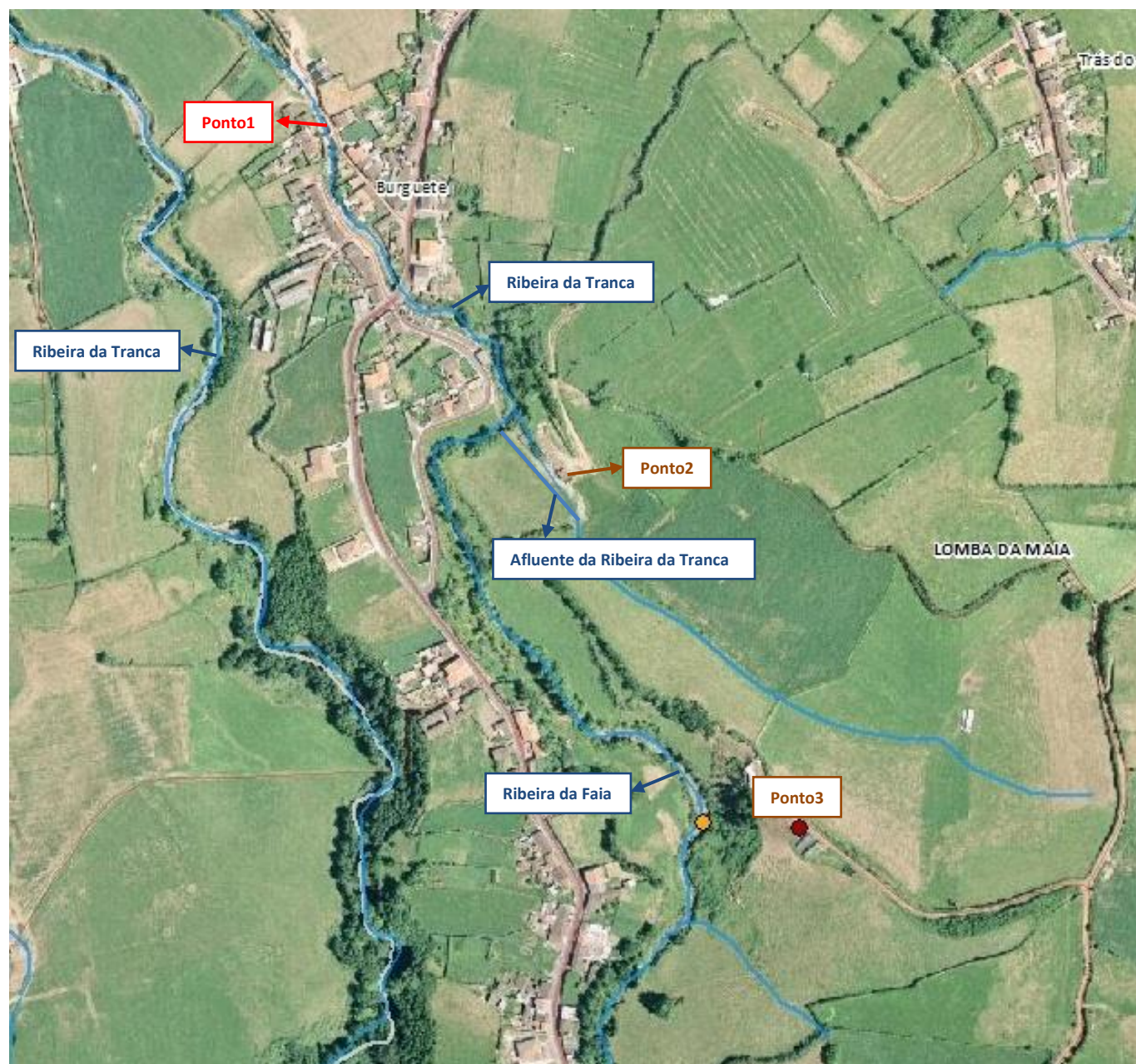
Figura 7: Localização dos locais verificados da Ribeira da Tranca (Ponto 1), exploração pecuária imediatamente a montante das Travessas do Burguete (Ponto 2), exploração pecuária mais a montante (PCO-2020-0226) – Ponto 3 e identificação das linhas de água. Adaptado do SIGAM.

Natureza dos SASM, em 23/05/2019, devido a escorrências de efluentes pecuários para a linha de água (Ribeira da Faia).