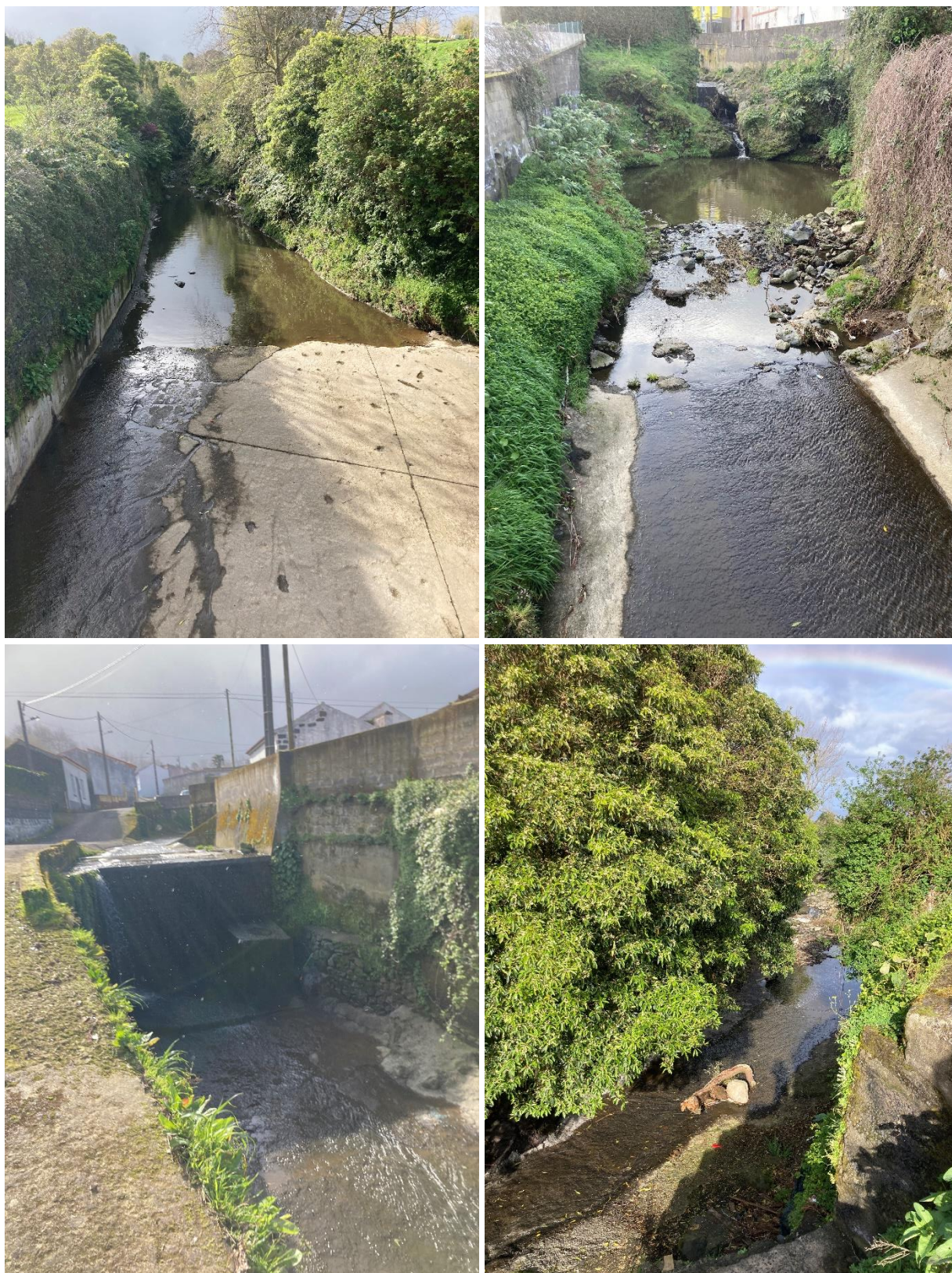
Figuras 2 a 5: Ribeira da Tranca vista da 1.ª travessa do Burguete. Local assinalado no Ponto 1 da Figura 7.