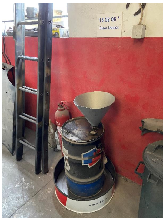
Foto 3-Reservatório de óleo mineral usado.