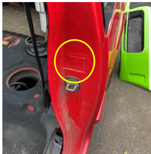
Foto 2-Identificação removida no pilar central.