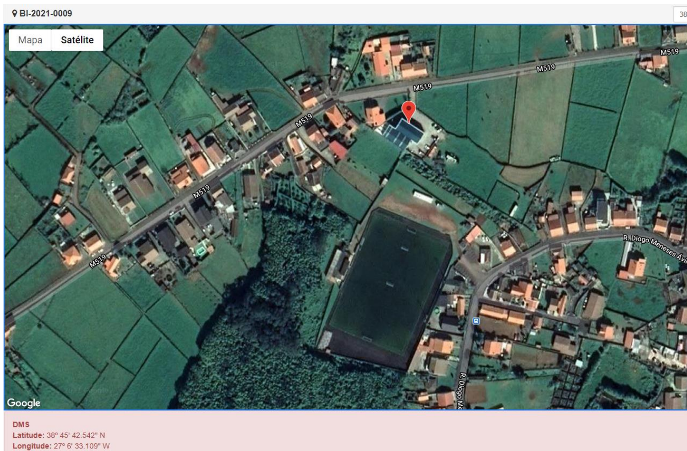
Figura 1.1: Localização do estabelecimento inspecionado.

Licenciamento da atividade: Alvará de utilização n. 13/2015 (CMPV)