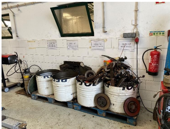
Foto 1 – Armazenagem de absorventes contaminados. Foto 2 – Separação de diferentes resíduos da oficina.