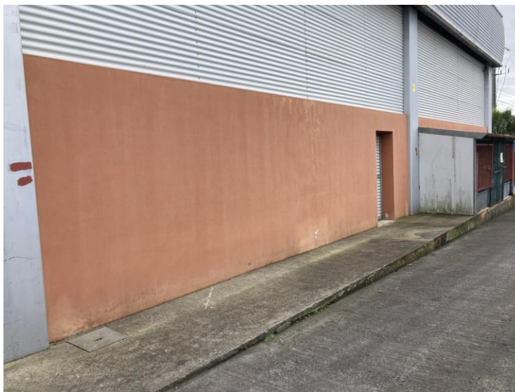
Figura 3: Local constante do auto de notícia. Imagem de 02/03/2021.

Na deslocação ao local foi possível verificar que os bidões identificados no processo já não se encontravam no local.