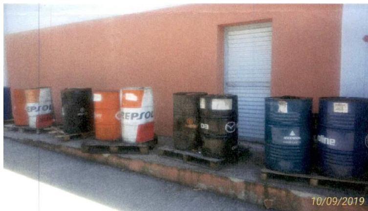
Figura 2: Imagem constante do auto de notícia n.º NPC-00009/2019 220300000

O SEPNA/GNR levantou, em 10/09/2019, um auto de notícia (NPC-00009/2019 220300000) ao OGR Serralharia do Outeiro por ter sido verificado, nas instalações das Murtas, o armazenamento de óleos minerais usados (LER 130208*) em 10 bidões, com capacidade para 200 litros cada, no exterior das instalações destinadas para o efeito e sem disporem de bacias de retenção.