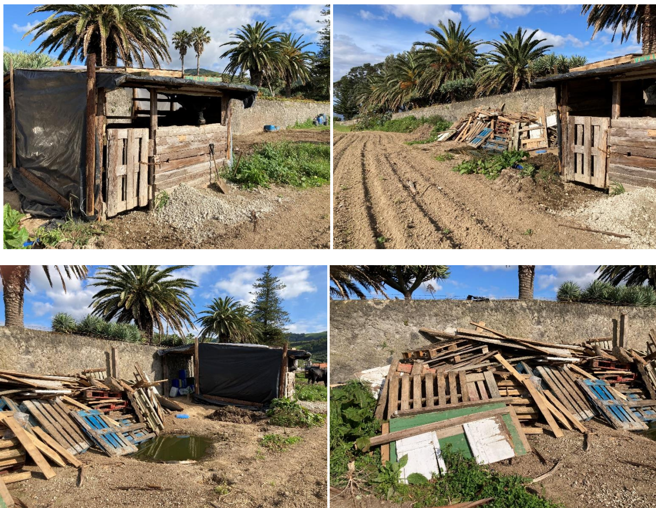
Figuras 4 a 7 – Construção parcialmente demolida, tendo permanecido apenas um curral.