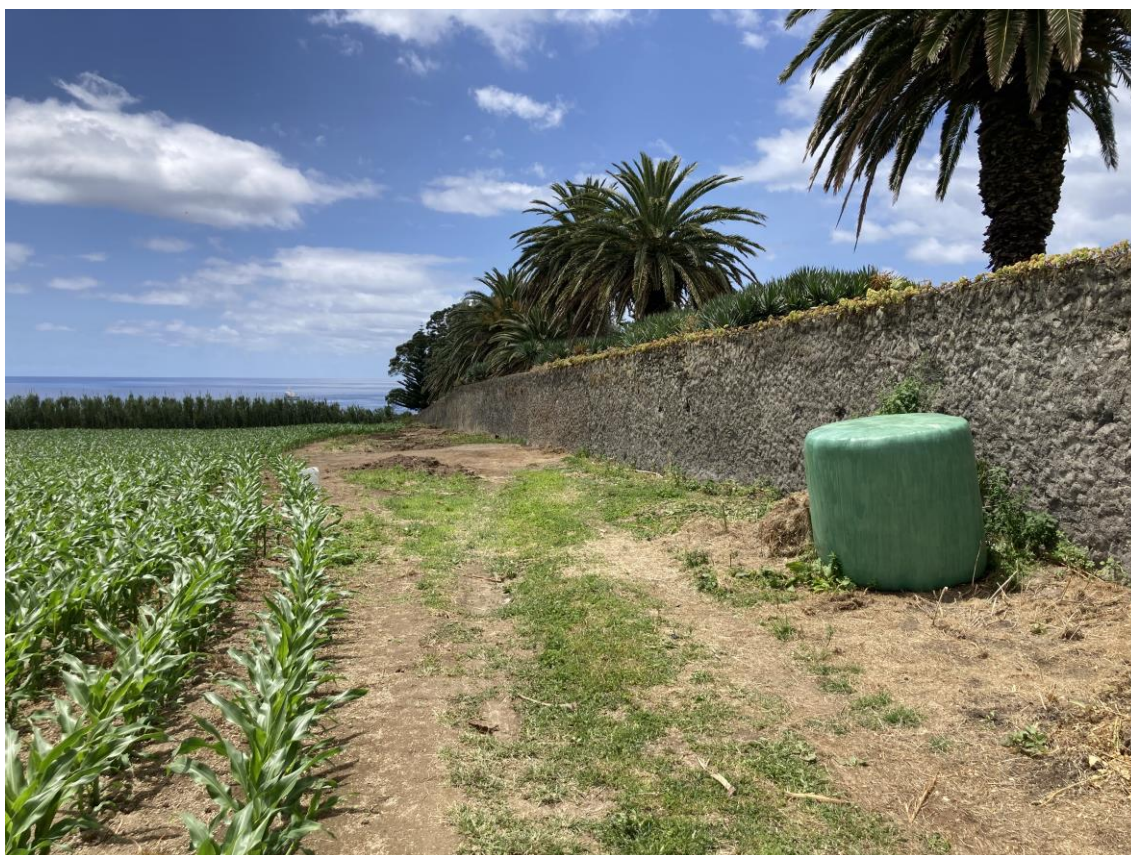
Figuras 8 – Local onde se encontrava a construção demolida e os resíduos de madeira depositados.