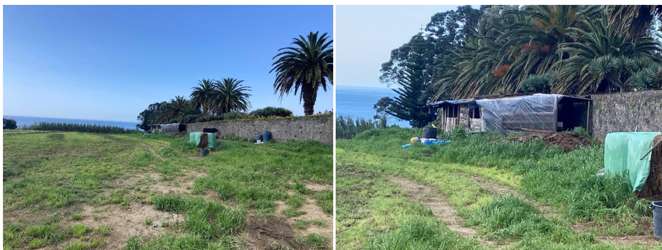
Figuras 2 e 3 – Vista geral da construção.

Na primeira deslocação efetuada ao local, foi contactada na sua residência, a esposa do proprietário que nos informou que a referida construção tratava-se de uma construção provisória, constituída por paletes e costaneiras (madeira) e uma cobertura em manga plástica, com as dimensões aproximadas de 15m de comprimento por 3 m de largura. A construção dessa estrutura foi efetuada por altura das Festas do Divino Espírito Santo do ano de 2020, com o objetivo de abrigar os animais criados para serem abatidos nessa festividade.