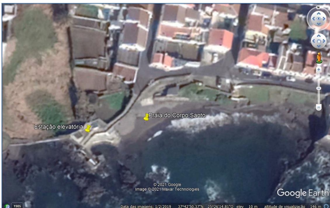
Figura 2.1: Estação elevatória junto à Praia do Corpo Santo (adaptado de Google Earth).