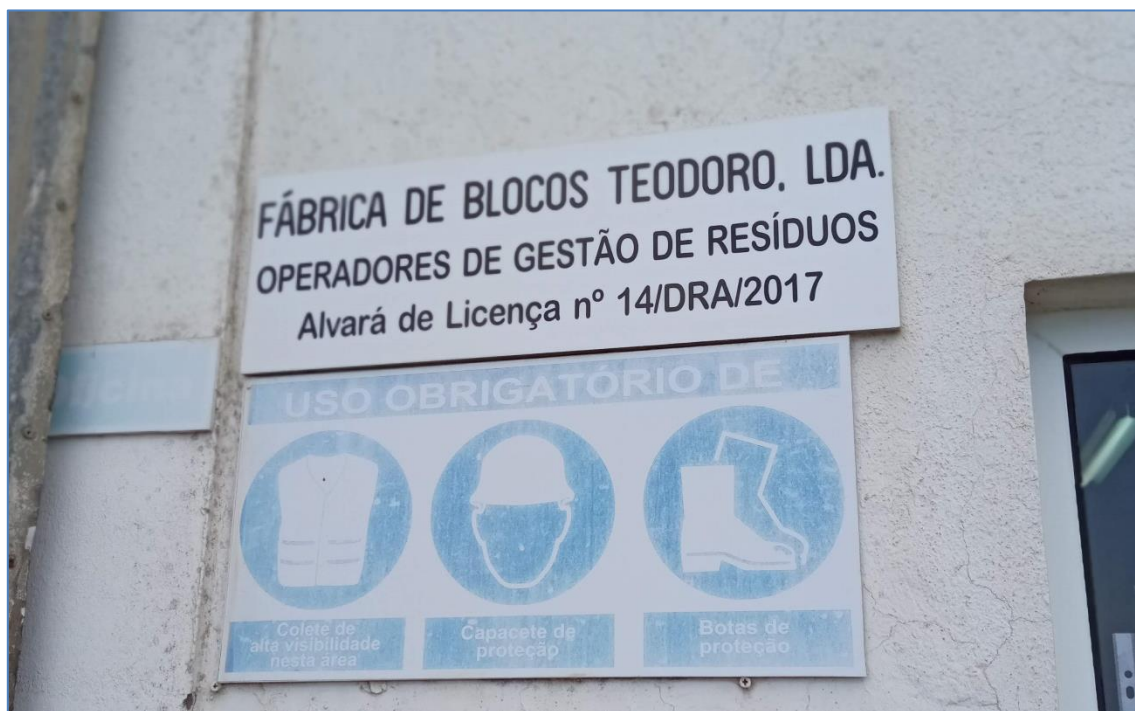
Figura 2.1: Painel afixado na parede do edifício do escritório.

O operador afixou um painel na parede do edifício de escritório, a mais de 30 m do portão de acesso da via pública, contendo a designação da empresa e a identificação do alvará de operador de gestão de resíduos. Para além da deficiente visibilidade a partir do exterior, o painel não continha informação sobre os dias e horário de funcionamento nem os contactos telefónicos e eletrónicos dos responsáveis pela instalação.