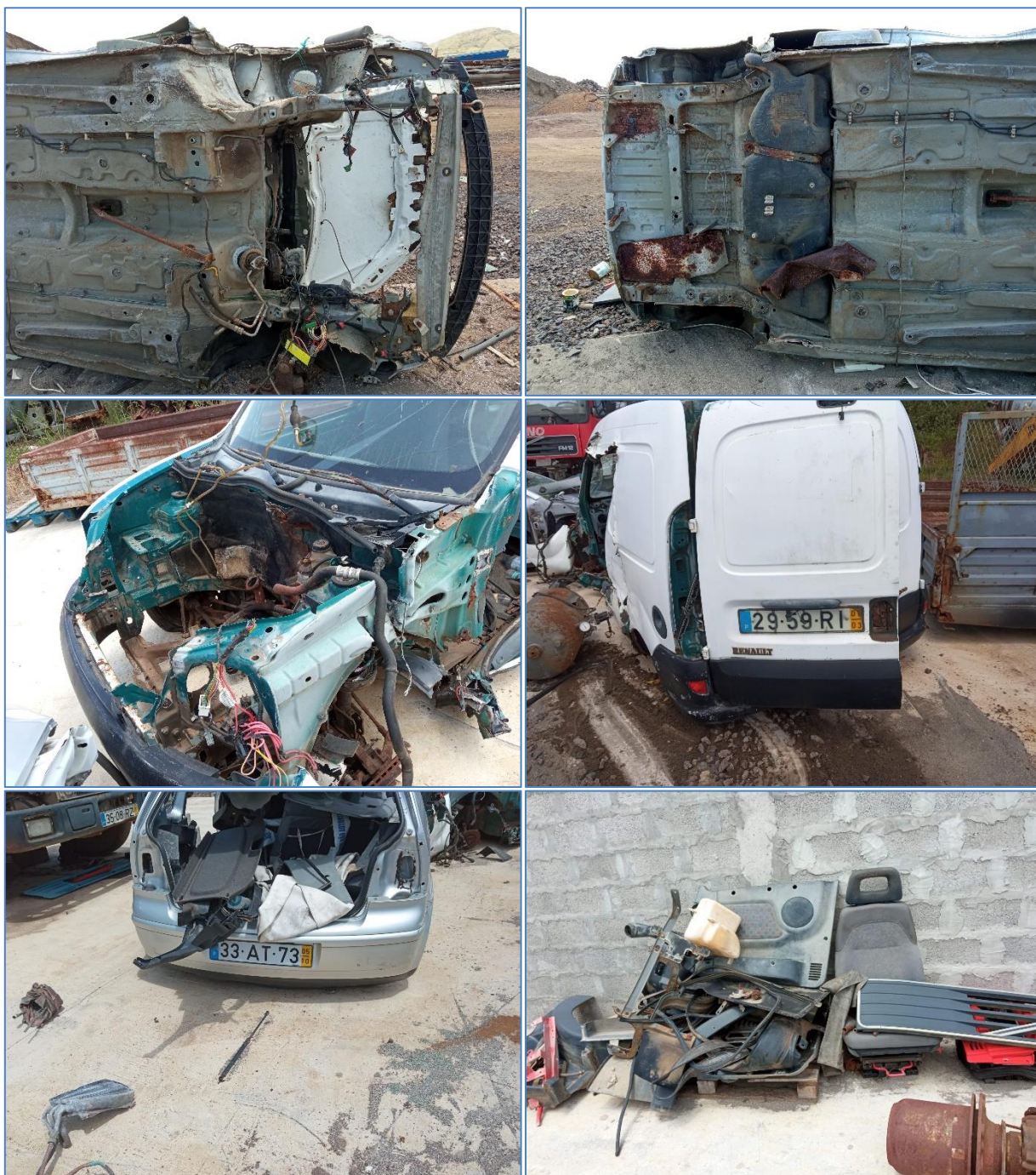
Figura 2.8: Veículos ligeiros e seus componentes.