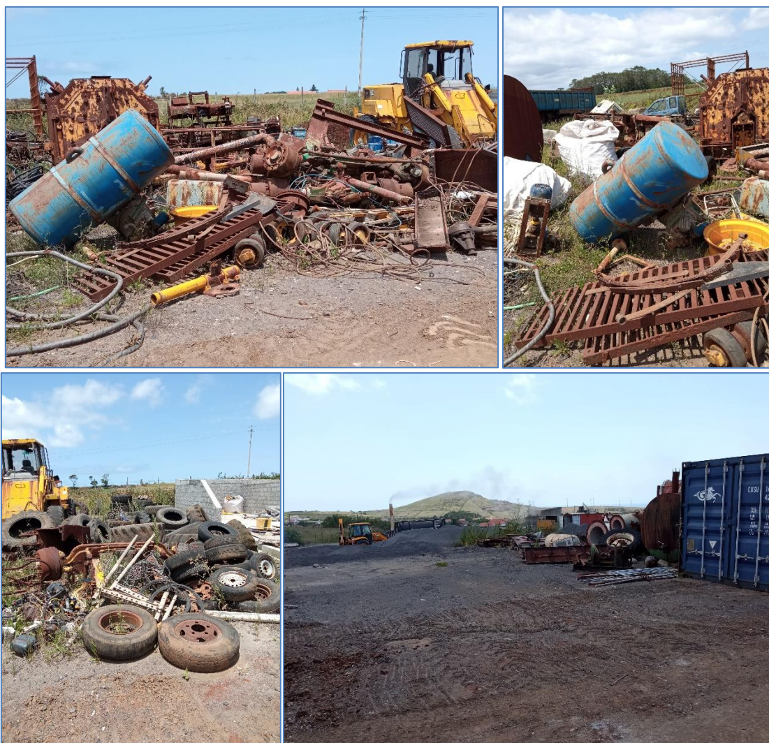
Figura 2.4: Equipamentos (ou resíduos?) alegadamente alheios à atividade de gestão de resíduos.

operação de gestão de resíduos. Mesmo nas zonas claramente afetas à atividade de gestão de resíduos, como a zona compartimentada referida anteriormente e a zona de deposição de inertes, não existe qualquer identificação das tipologias de resíduos a que se destinam. Por outro lado, a maioria dos equipamentos ali existentes encontram-se de tal forma degradados, alguns mesmo parcialmente desmantelados, que faz supor que se trata de resíduos.