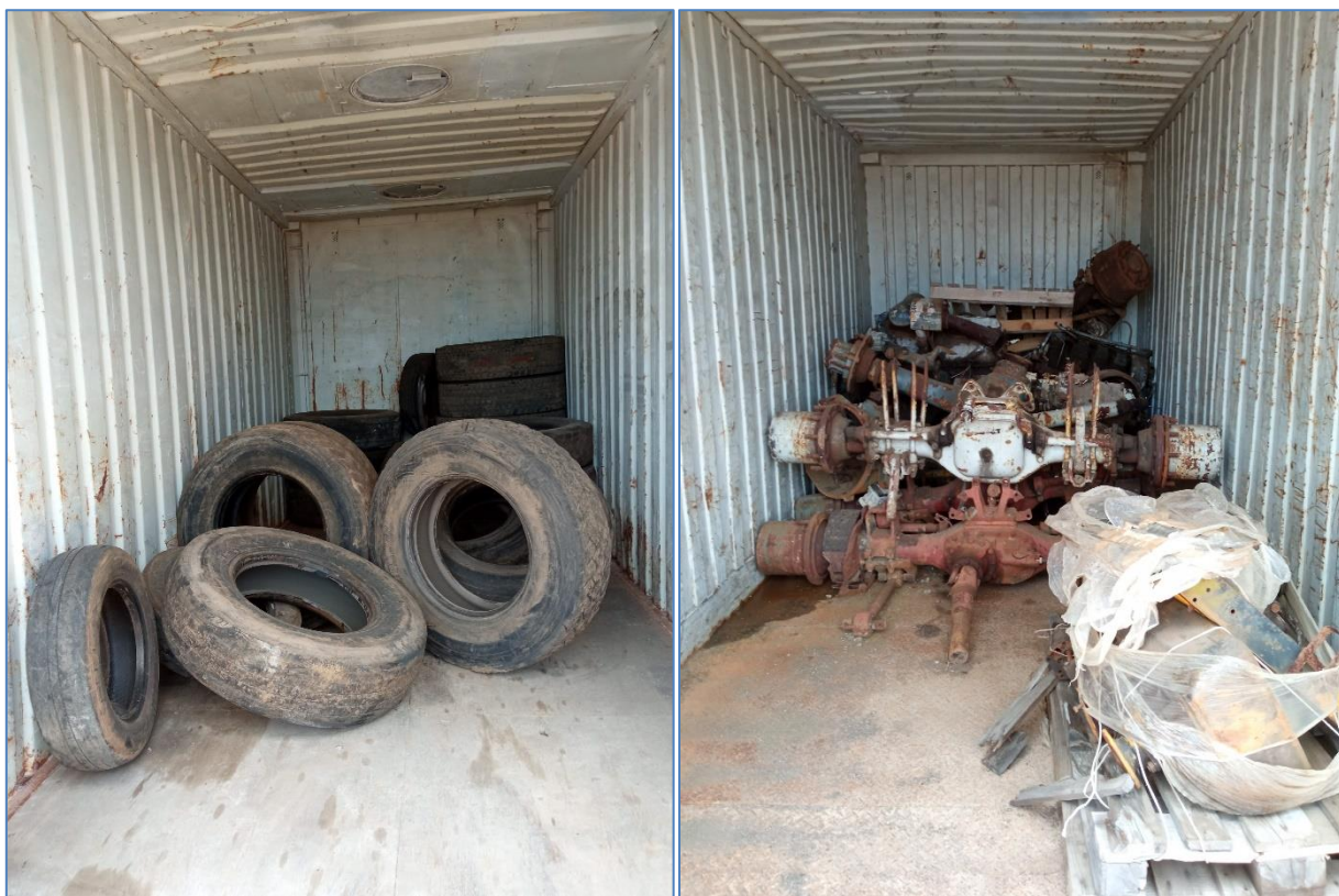
Figura 2.6: Contentores com pneus usados e com partes de veículos pesados, incluindo um motor.

A instalação não possui báscula para quantificar os resíduos admitidos. O operador alegou que, quando necessário, recorre à báscula do Centro de Processamento de Resíduos de Santa Maria.