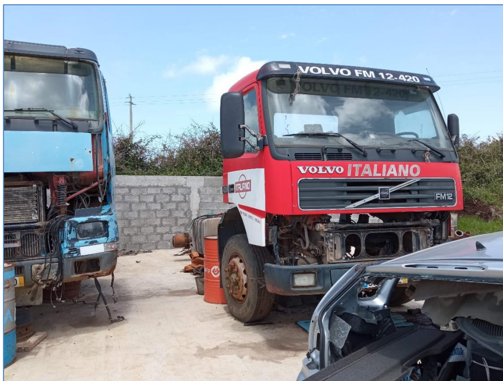
Figura 2.9: Veículos pesados.