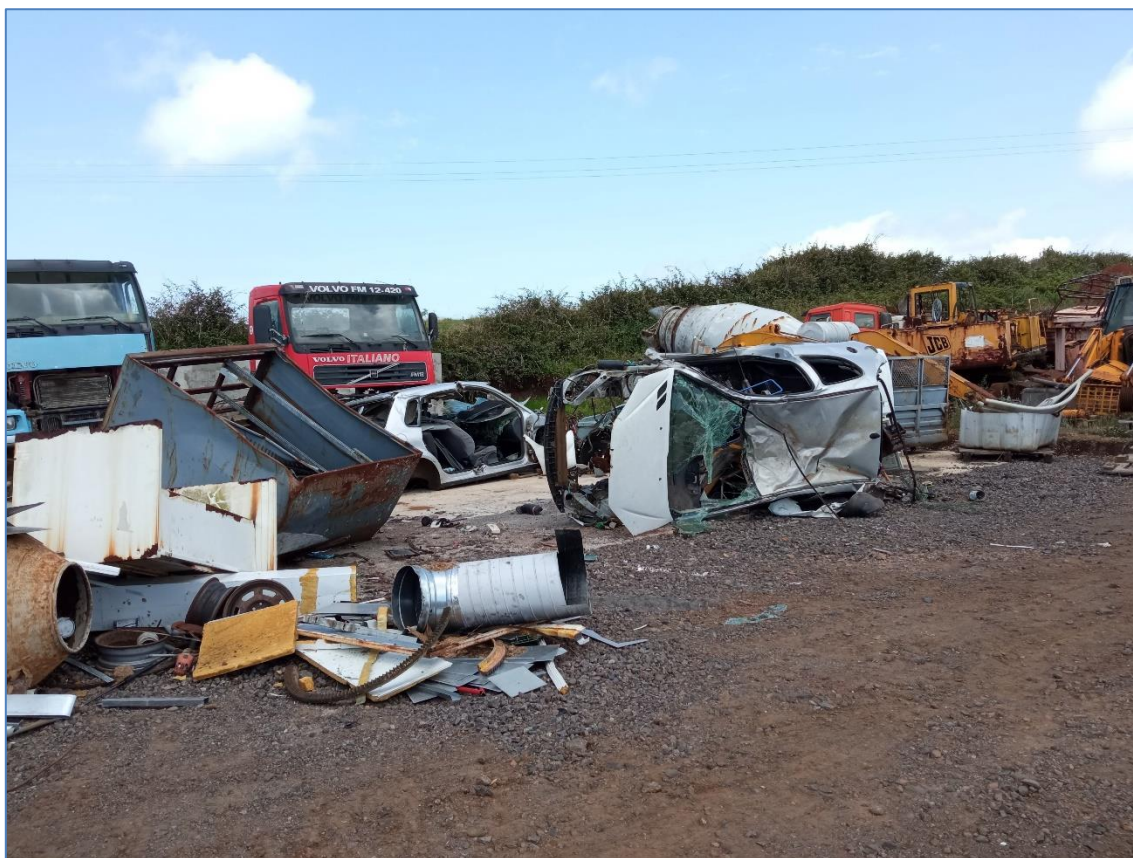
Figura 2.7: Veículos ligeiros, pesados e máquinas industriais nas instalações.