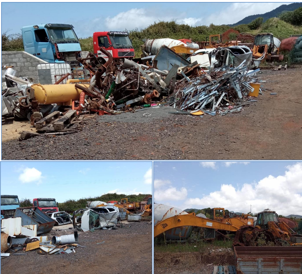
Figura 2.5: Resíduos existentes entre a zona compartimentada e a zona de deposição de inertes.