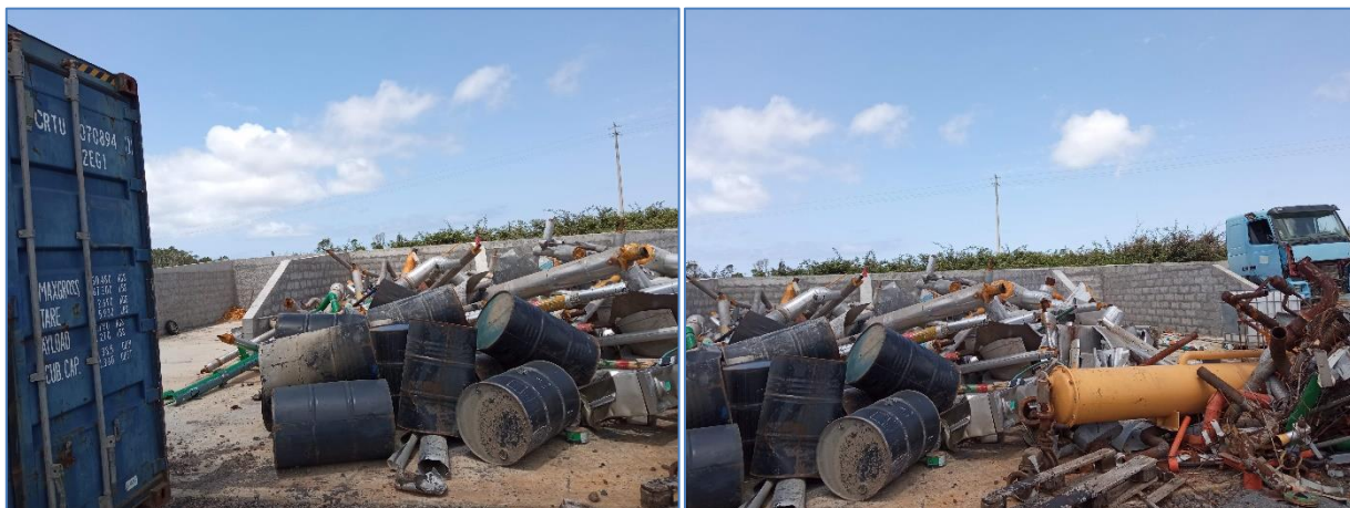
Figura 2.2: Células visíveis atrás dos resíduos.

Construiu uma zona pavimentada com 5 células, mas não estava dotada de toldo amovível nem de vala com grelha de drenagem.