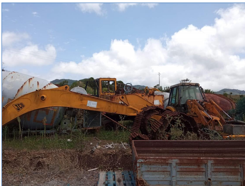
Figura 2.10: Máquinas industriais