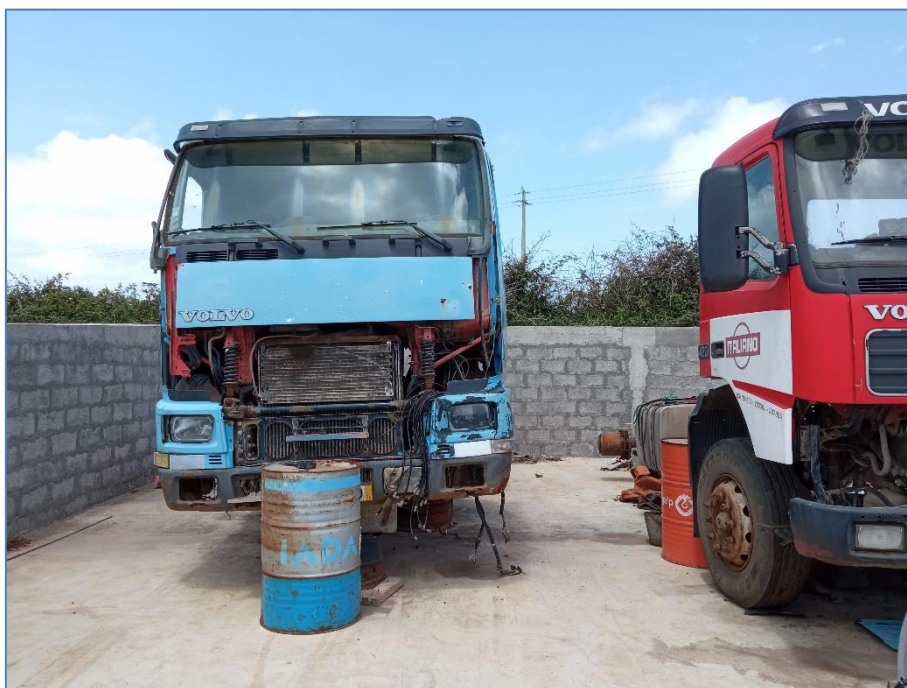
Figura 2.3: Veículos pesados armazenados numa das células.