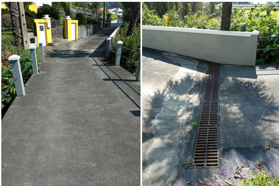
Figura 2.3: Grelha de drenagem de águas pluviais na Canada da Grotta.