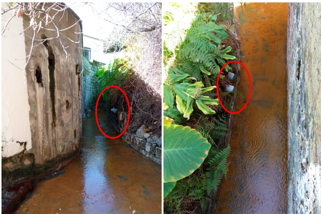
Figura 2.2: Tubagens de PVC existentes na margem esquerda da Ribeira Amarela.