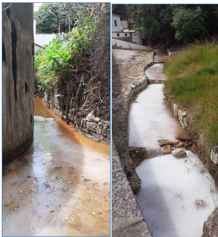
Figura 2.1: Duas das fotografias que acompanhavam a denúncia.

Na visita efetuada ao local no dia 30/09/2021 confirmou-se a existência de duas canalizações de PVC na margem esquerda da Ribeira Amarela, no troço contíguo à empena da loja de artesanato/recordações existente na zona das Caldeiras das Furnas (figura 2.2). Naquele momento não existia qualquer escorrência dos tubos.