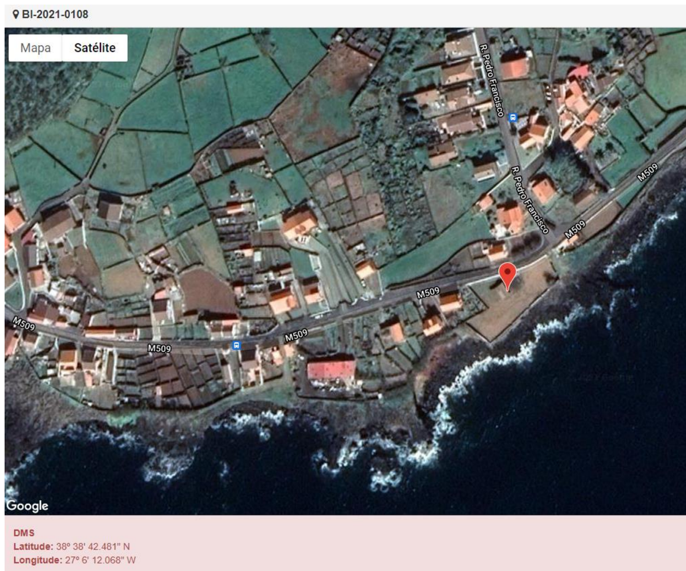
Figura 1.1: Localização do estabelecimento inspecionado.