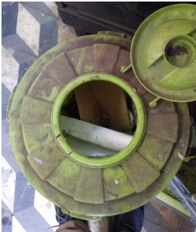
foto 1-Mistura de resíduos na oficina.