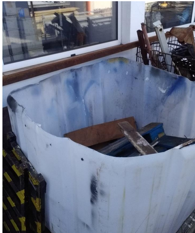
foto 2- Armazenamento de madeira sem código LER.