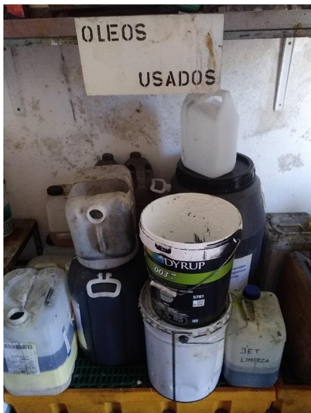
foto 3-Armazenamento de óleos sem código LER