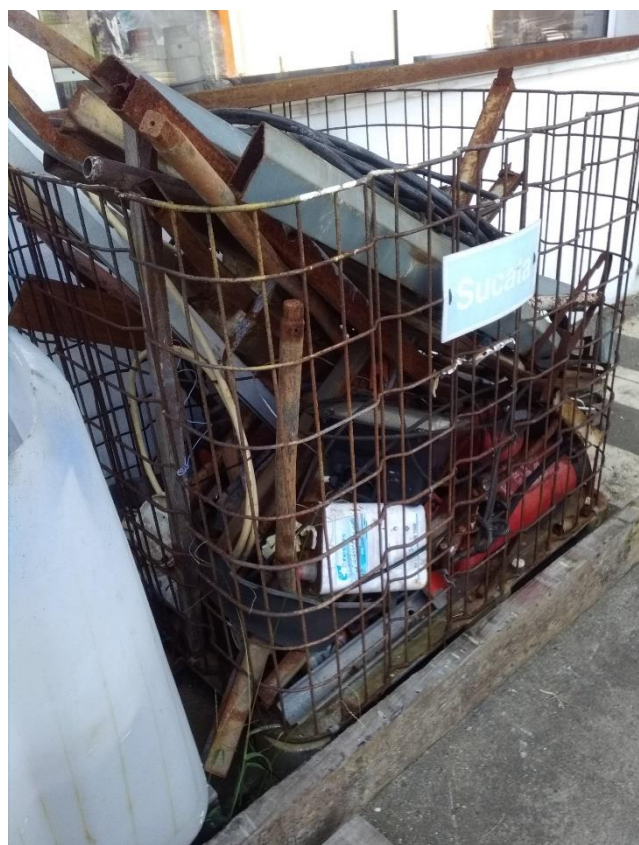
foto 4-Armazenamento de metais sem código LER