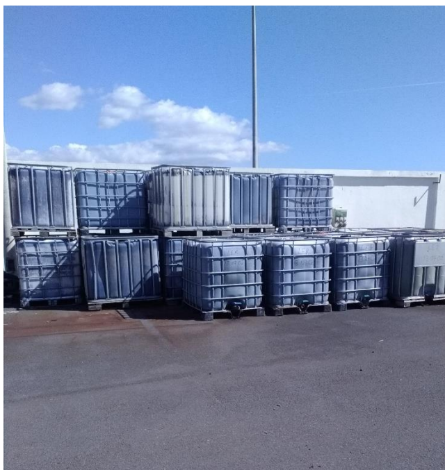
foto 3-Mistura de combustíveis armazenados a aguardar expedição, incorretamente identificados.