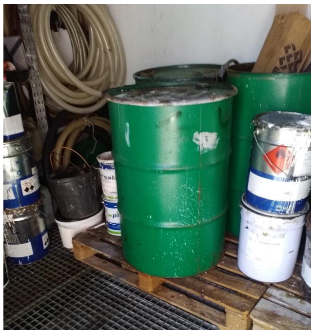
foto 4- Armazenamento de resíduos sem código LER.