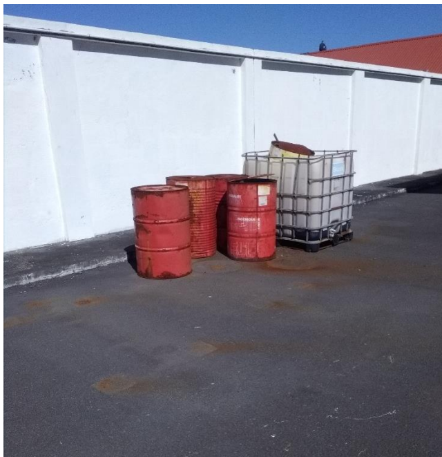
foto 1-Resíduos metálicos armazenados sem identificação.