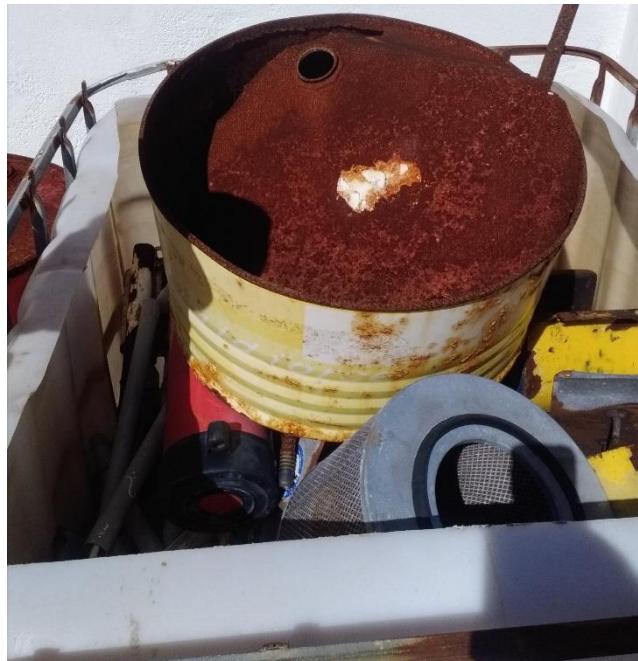
foto 2- Armazenamento de metais sem código LER.