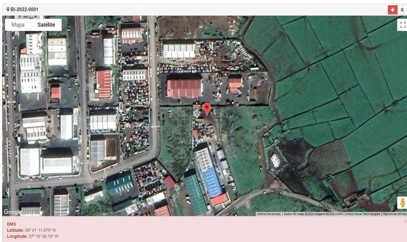
Figura 1.1: Localização do estabelecimento inspecionado.

Licenciamento da atividade: Alvará nº 1/DRA/2019