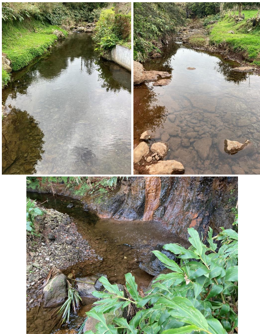
Figura 2 a 4 – Ribeira das Lixívias, em 3 locais distintos.

Na verificação do estado da linha de água, a água apresentava-se límpida e sem indícios de qualquer contaminação, em todos os locais, nomeadamente no mais próximo da unidade industrial (identificado na Figura 1).