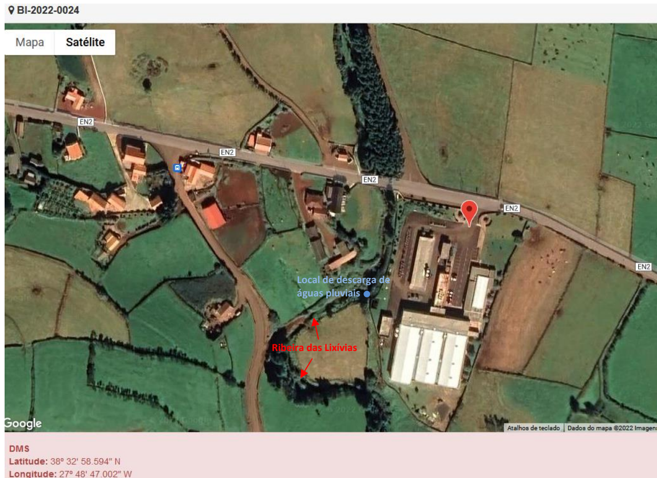
Figura 1 - Localização do estabelecimento inspecionado.