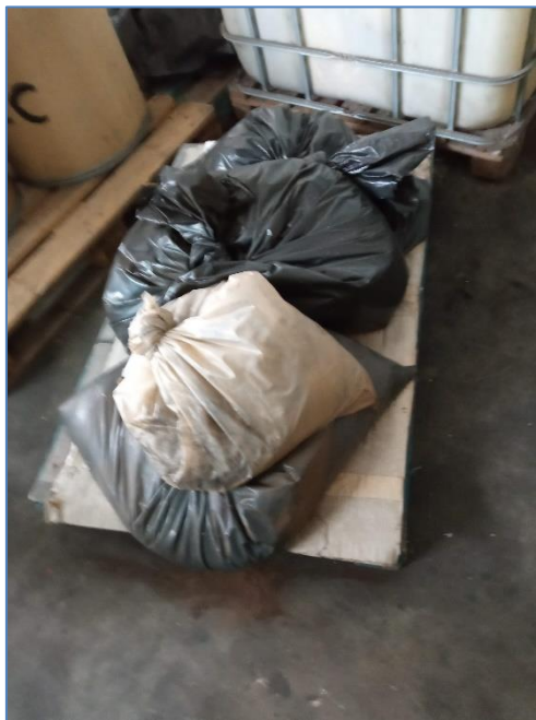
Figura 2.2: Resíduos não identificados (armazém de resíduos perigosos).