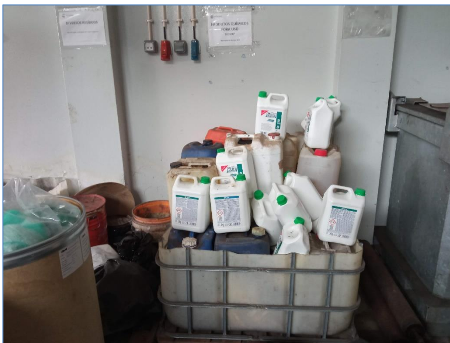
Figura 2.1: Armazenamento de resíduos líquidos.