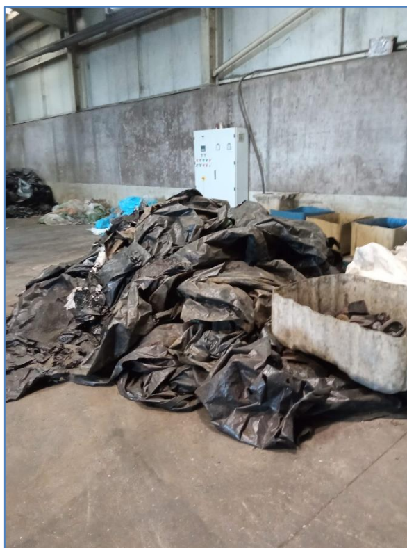
Figura 2.3: Resíduos não identificados (armazém de separação e valorização orgânica).