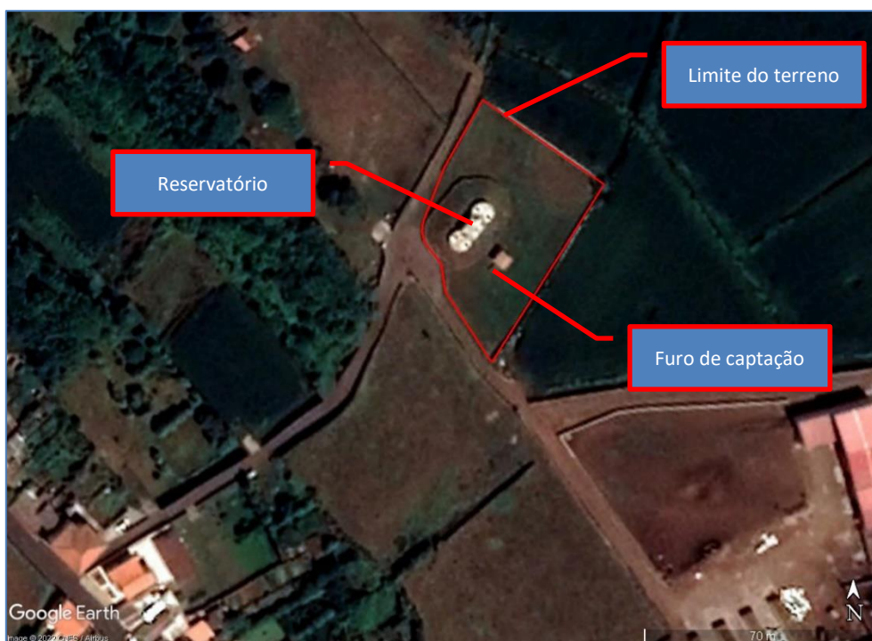
Figura 2.1: Captação de água do Pontal, Guadalupe.