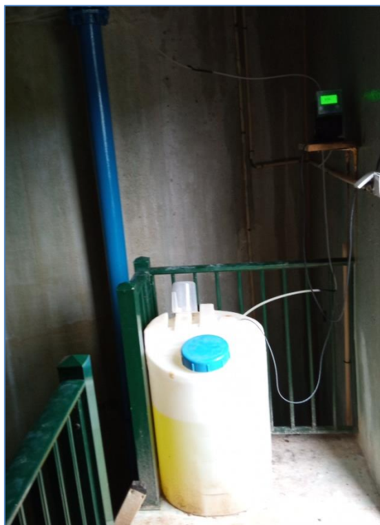
Figura 2.2: Tratamento da água captada.