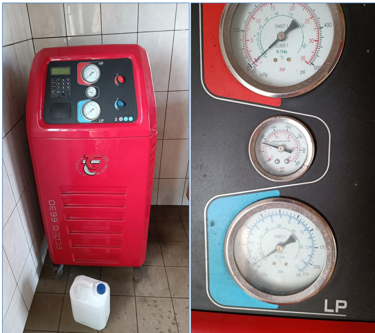
Figura 2.1: Máquina de manutenção de ar condicionado em veículos.