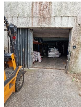
Figuras 2, 3 e 4: edifício principal e 2 armazéns do estabelecimento inspecionado.