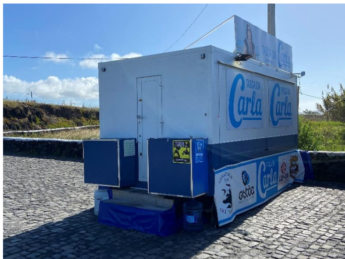
foto 1-Vista da rulote.