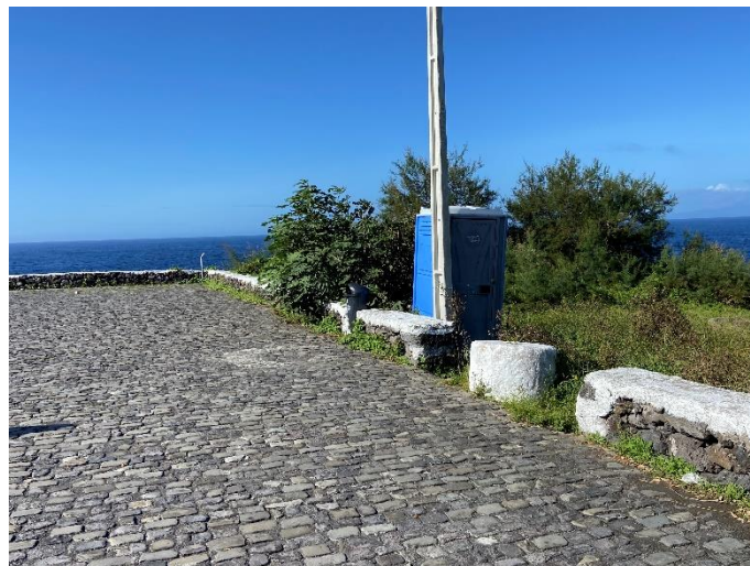
foto 4 - WC portátil, junto ao Mirante.