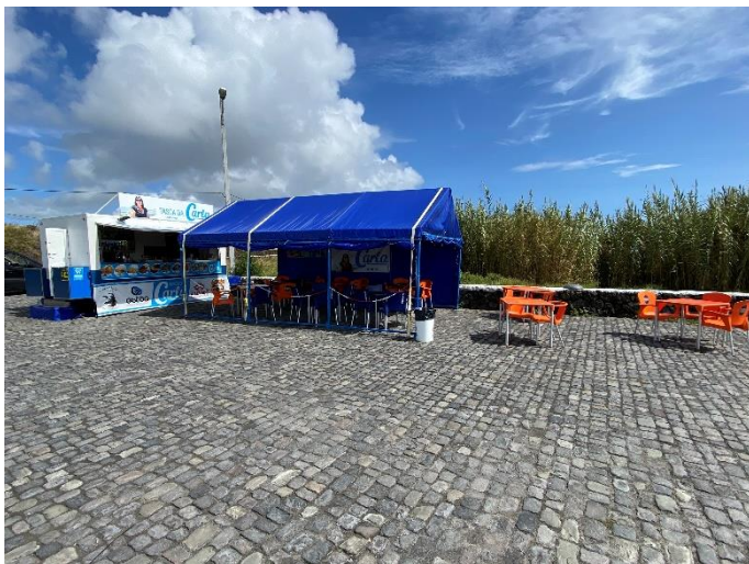
foto 3 - Tasca aberta com explanada.