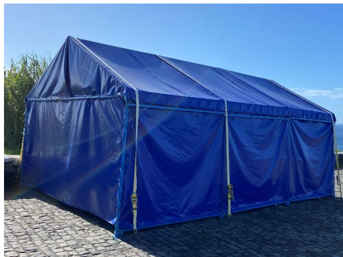
foto 2-Vista da tenda.