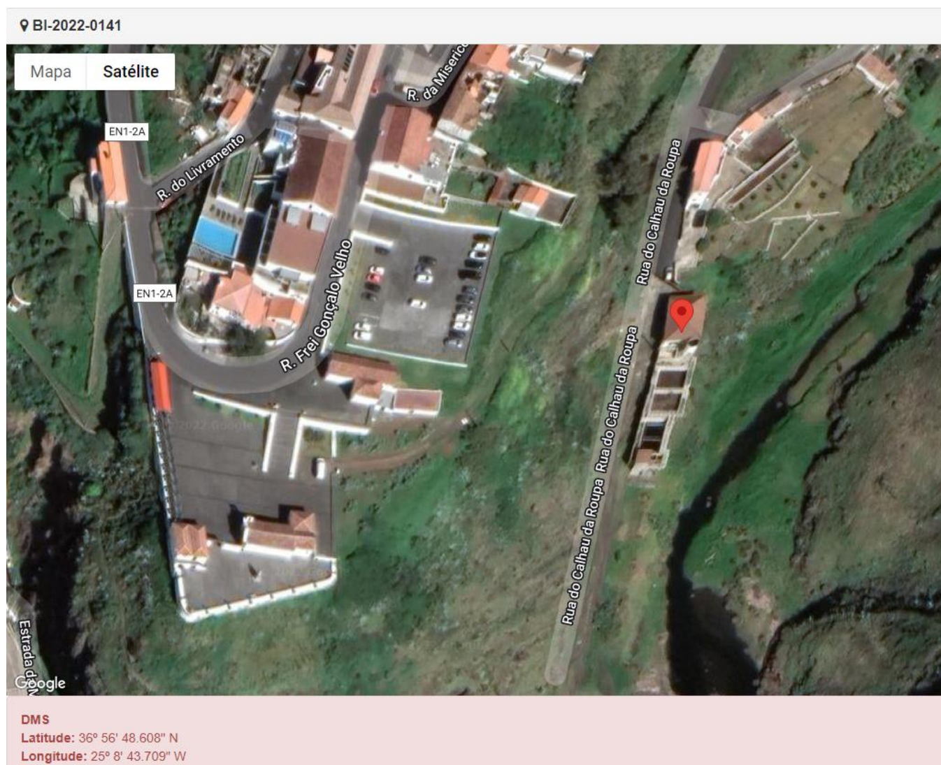
Figura 1.1: Localização do estabelecimento inspecionado.