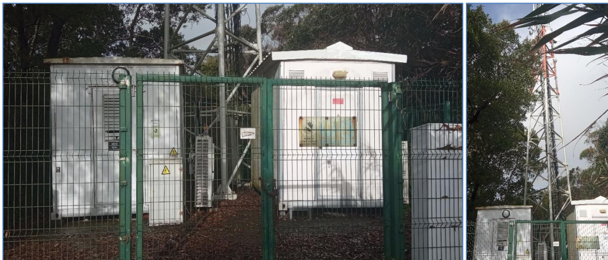
Figura 2.1: Estação de base Fajã de Cima (776)

Os equipamentos de ar condicionado estavam parados por avaria. Os equipamentos de ventilação estavam em funcionamento, mas não produziam ruído que se conseguisse ouvir na zona habitacional da origem da queixa (localizada a cerca de duzentos metros da estação). Não foi detetada no local outra fonte de ruído para além dos sistemas de climatização e ventilação.