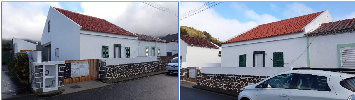
Figura 2.3: Aspeto da construção no dia 08/07/2023.