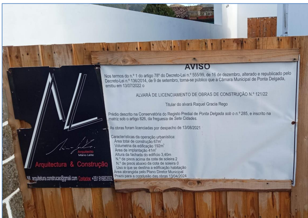
Figura 2.2: Aviso afixado no portão de entrada (08/07/2023).

Na deslocação efetuada à obra verificou-se que os trabalhos ainda não estavam concluídos, mas não se encontrava ninguém no local. No portão de entrada encontrava-se afixado o aviso do alvará de licença de construção, com o n.º 121/22, sendo o prazo para conclusão das obras até 13/04/2024.