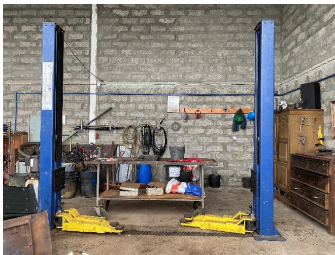
Foto 12 – Kit de contenção de derrames junto ao equipamento de despoluição de VFR.