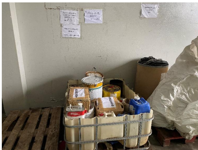
Foto 4 – Acondicionamento dos resíduos no armazém de resíduos perigosos.