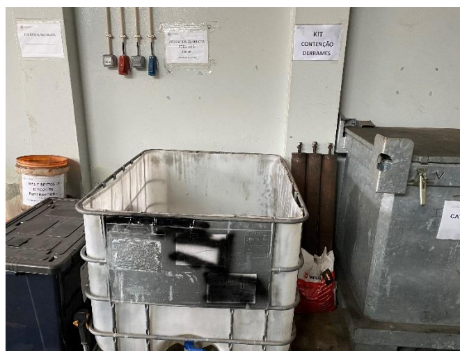
Foto 2 – Acondicionamento dos resíduos no armazém de resíduos perigosos.