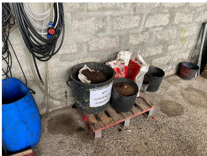
Foto 11 – Kit de contenção de derrames junto ao equipamento de despoluição de VFR.