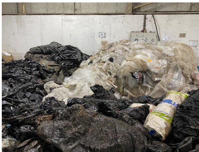
Foto 8 – Pontos de deposição de plásticos devidamente identificados.