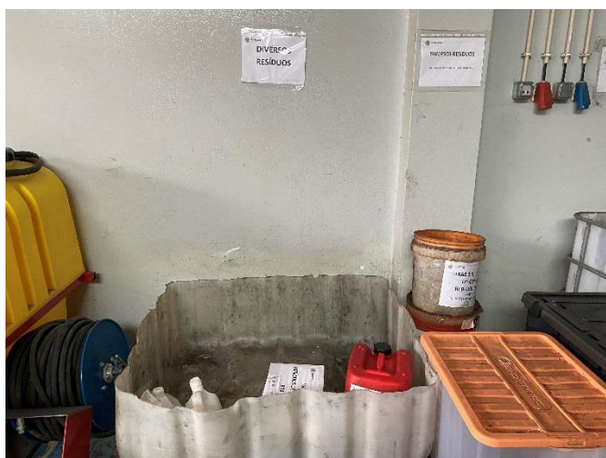
Foto 1 – Acondicionamento dos resíduos no armazém de resíduos perigosos.

Verificou-se que a situação da acumulação excessiva de vasilhame numa mesma bacia de retenção, detetada em inspeção anterior, foi corrigida, encontrando-se todos os resíduos devidamente acondicionados e identificados.