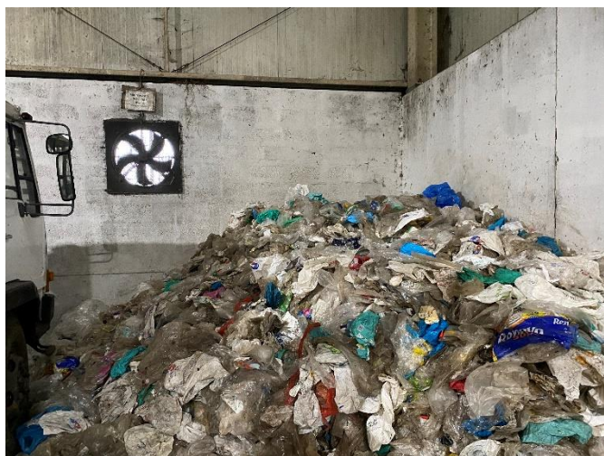
Foto 7 – Ponto de deposição de plásticos devidamente identificado.