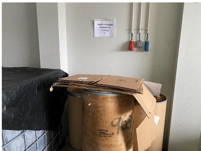
Foto 5 – Acondicionamento dos resíduos no armazém de resíduos perigosos.