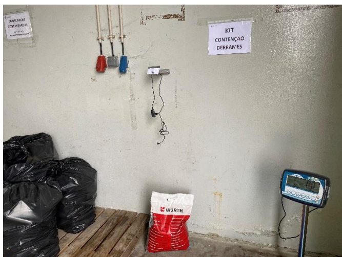
Foto 9 – Kit de contenção de derrames no armazém de resíduos perigosos.

Verificou-se a colocação/disponibilização de material absorvente para derrames em vários pontos da instalação, nomeadamente no armazém de resíduos perigosos, na zona junto aos reservatórios de fluidos e junto ao equipamento de despoluição/desmantelamento de VFV.