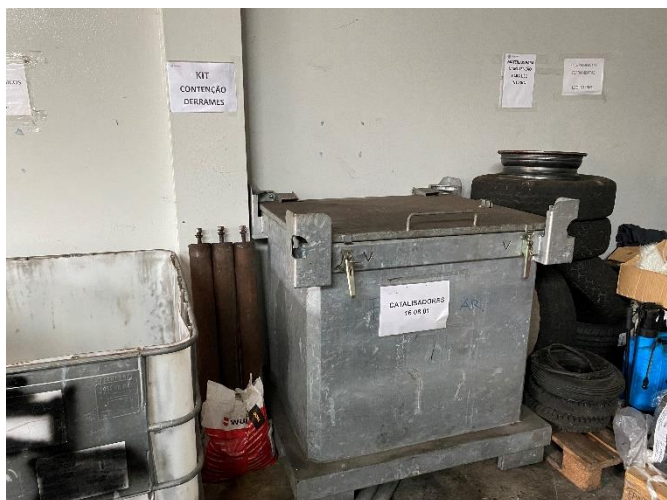
Foto 3 – Acondicionamento dos resíduos no armazém de resíduos perigosos.