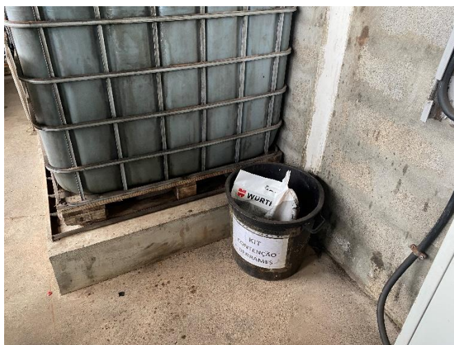
Foto 10 – Kit de contenção de derrames junto dos reservatórios de fluidos.